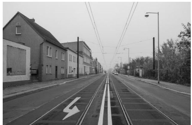
12_© Ulrich Wüst