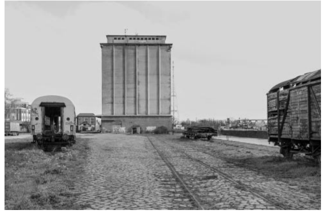
02_© Ulrich Wüst