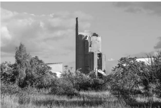
11_© Ulrich Wüst