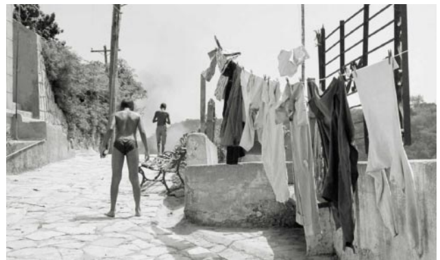
06_ Isla Granma, Santiago de Cuba, 2000 © Anneke Wambaugh