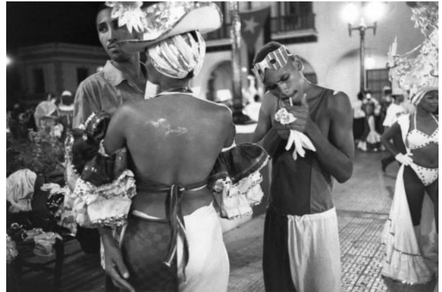
02_ Carnaval. Santiago de Cuba, 2006