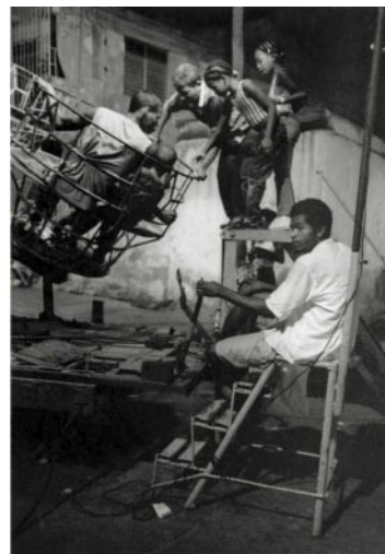
12_ Carnaval. Santiago de Cuba, 2006