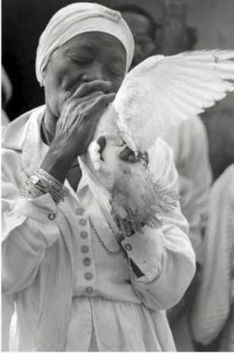
07_ Santera. Matanzas, 2001