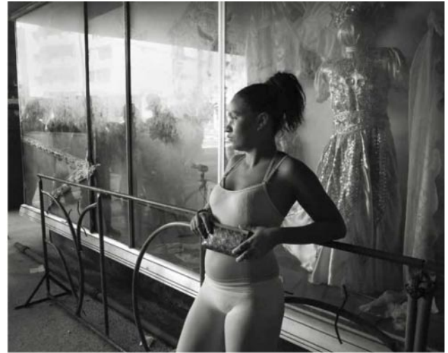
10_ Havana, 2016