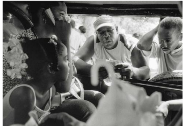
08_ Taxi Particular. Havana, 2006