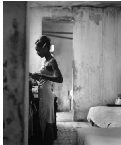
04_ © Havana, 2015 © Claire Garoutte