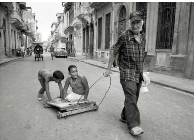
11_ Havana, 2022