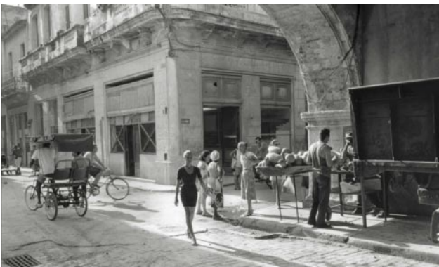
05_ Arco de Belén. Havana, 2000