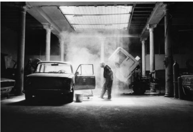
03_ Havana, 1998 © Claire Garoutte