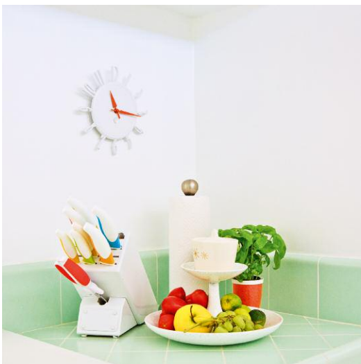
5 Green Tile