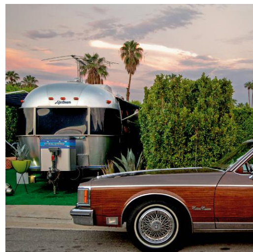
12 Airstream Sunset