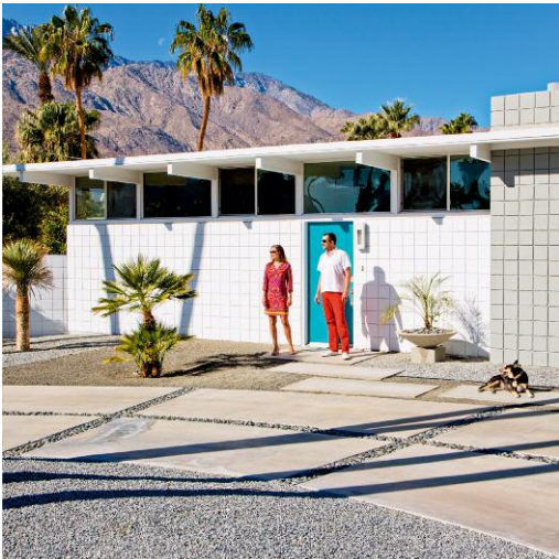
9 Bob's Closet