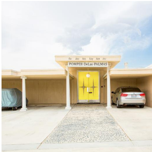
7 Desert Pompeii © NANCY BARON