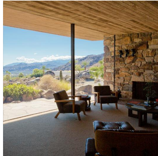
2 Edris with a View