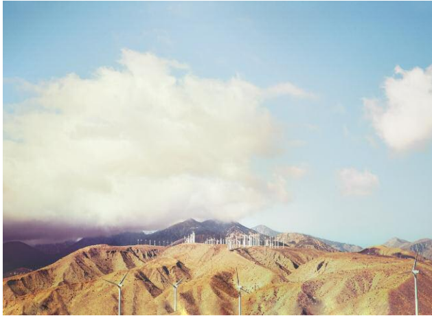
1 Desert Wind © NANCY BARON