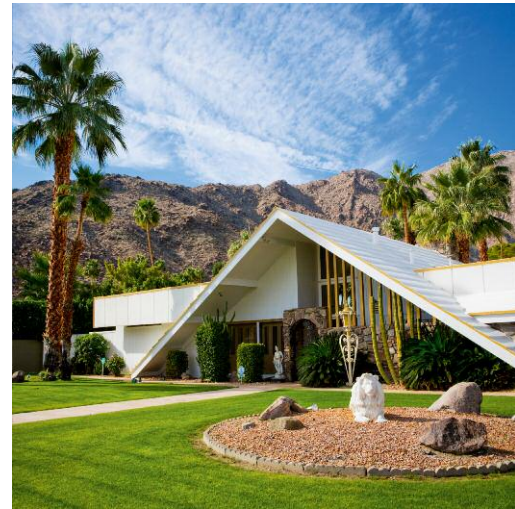
4 Lawn Lion