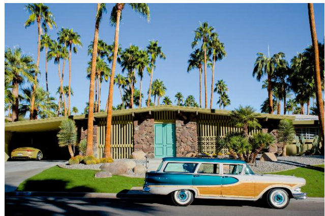
10 And the Cars to Match