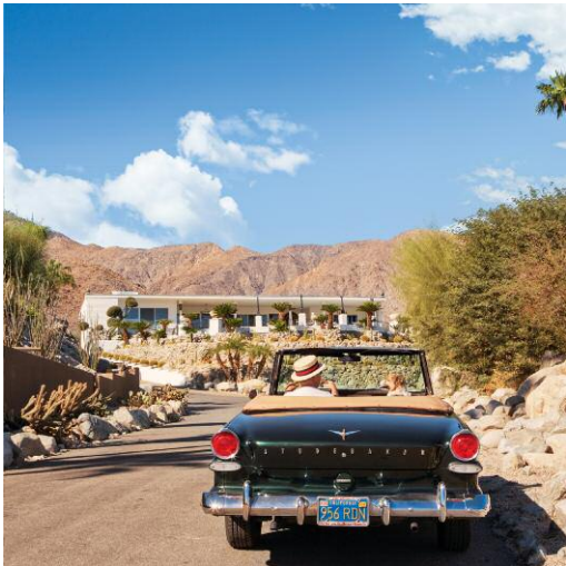
3 Sunday Drive