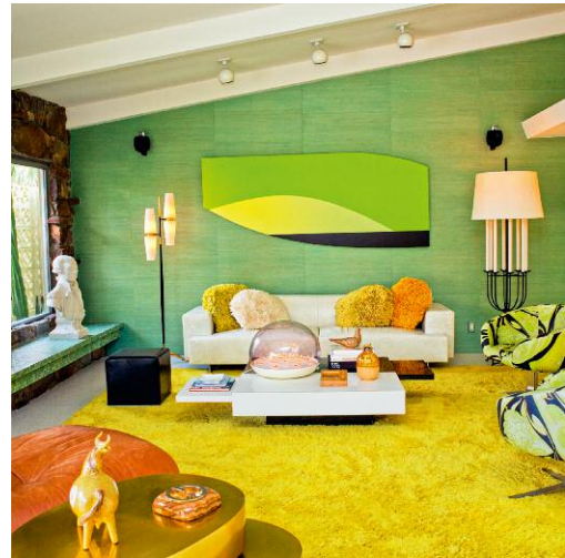
8 The Pucci Chair and All the Rest