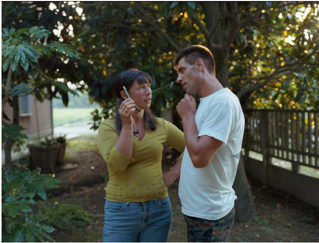
1 © Andrea Diefenbach