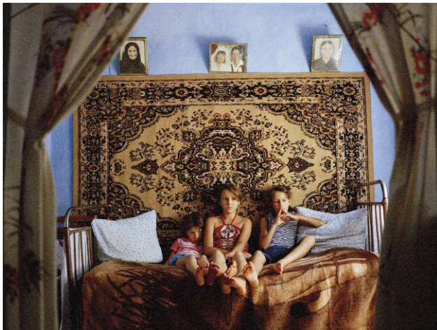
9 © Andrea Diefenbach