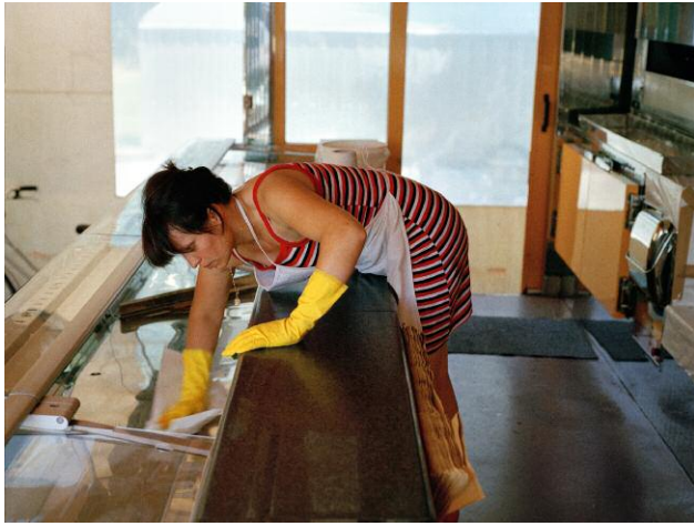
7 © Andrea Diefenbach