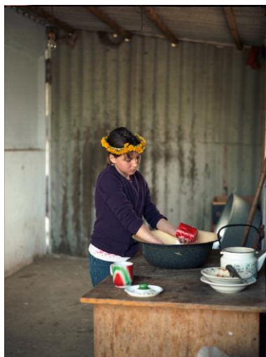
11 © Andrea Diefenbach