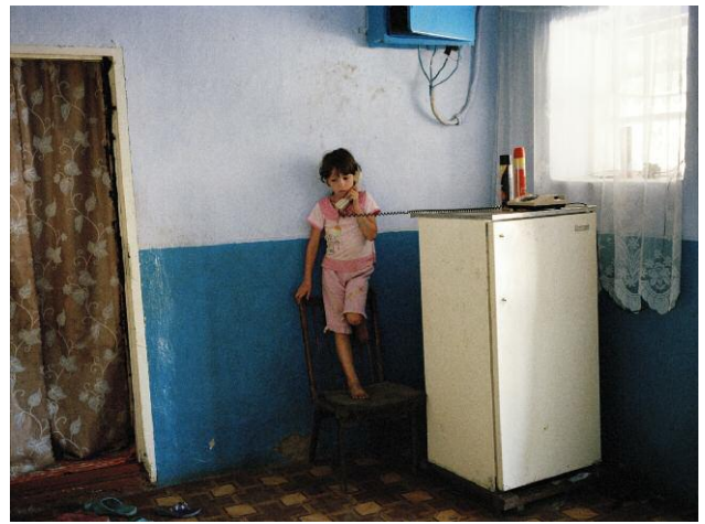
4 © Andrea Diefenbach