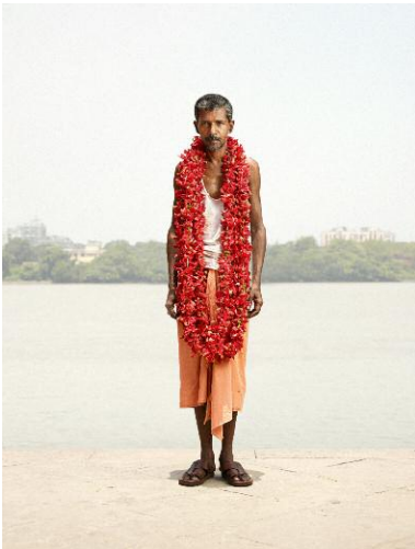
09 S. K. BHAGAT – Chinese Hibiscus