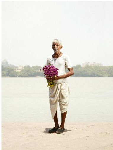
03 GORELAL DASS – Purple Globe Amaranth