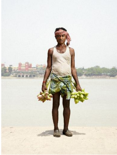
07 RAMASHISH – Lotus