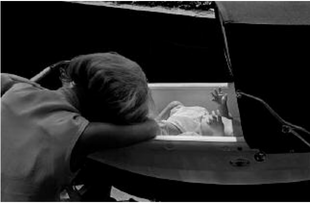
01_Riverside Drive, New York City, 1966