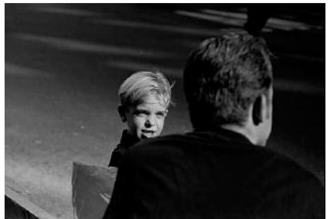
10_Parade, 5th Ave., New York City, 1995 © James Carroll