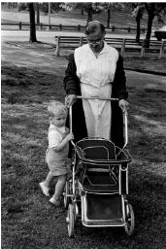
09_Central Park, New York City, 1966