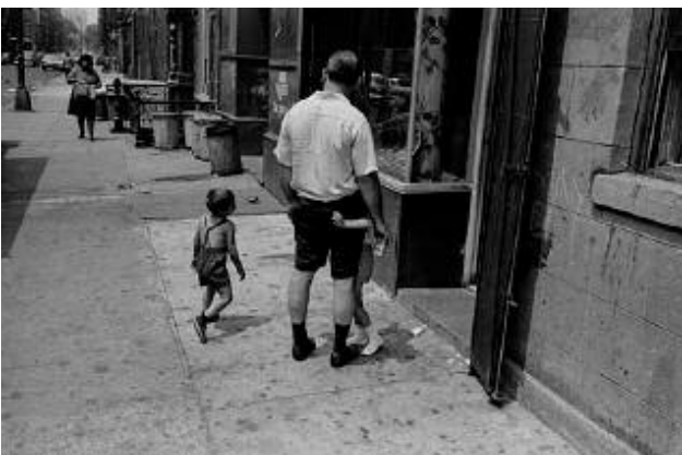
11_Avenue A, East Village, New York City, 1967