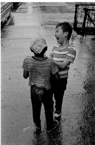
05_Avenue B, East Village, New York City, 1967