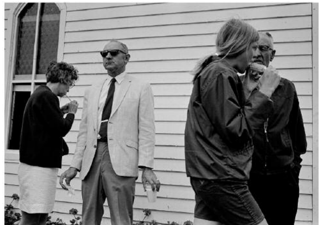
04_Kutztown Folk Festival, Pennsylvania, 1970