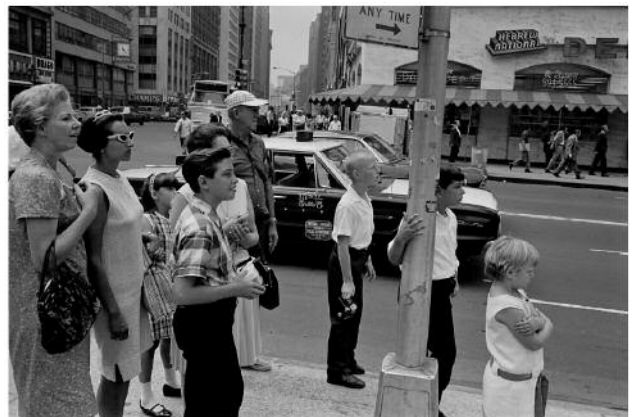
12_Near Times Square, New York City, 1967