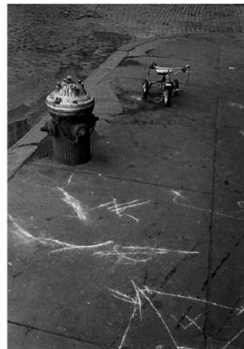
06_Water St., New York City, 1965