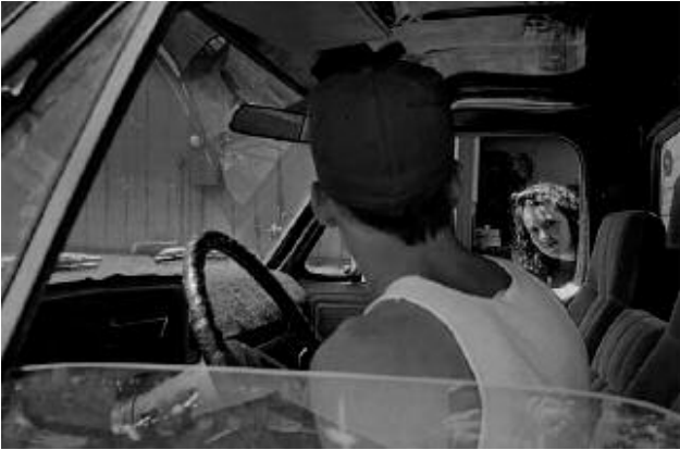
07_Sparks, Nevada, 1990