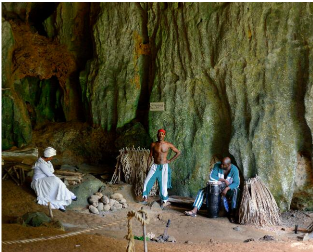
03 © Nicola Lo Calzo