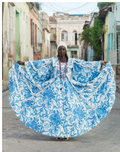
12 © Nicola Lo Calzo