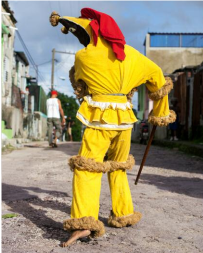
01 © Nicola Lo Calzo