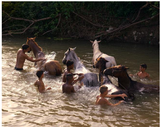
10 © Nicola Lo Calzo