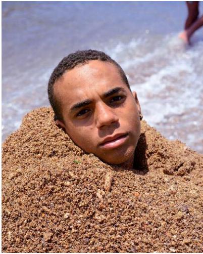
07 © Nicola Lo Calzo