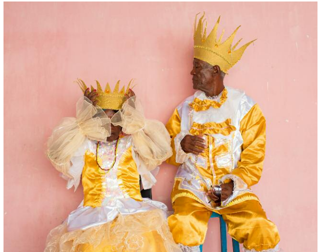
04 © Nicola Lo Calzo