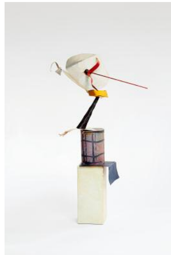
4 Untitled, 2004 © Auke de Vries