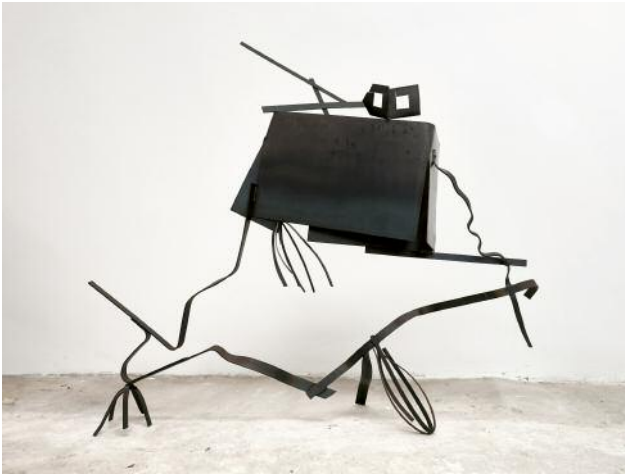
1 Untitled, 2011 © Auke de Vries