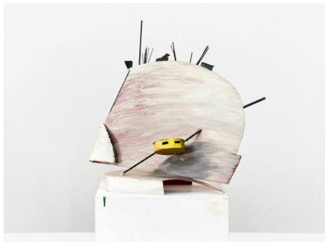
6 Untitled, not dated © Auke de Vries