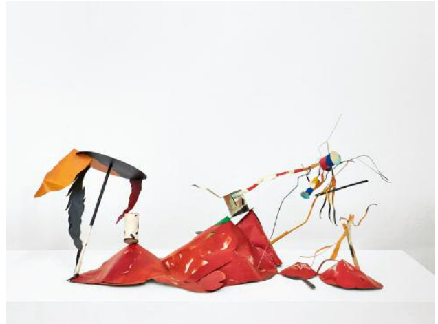
8 Untitled, 2014 © Auke de Vries, Photo: Piet Gispen