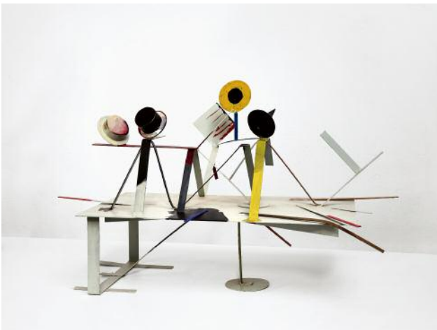
5 Bauhaus, 2017 © Auke de Vries, Photo: Piet Gispen