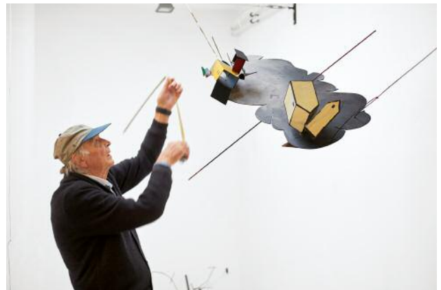
12 Auke de Vries with Pink Cloud, 2015 © Auke de Vries, Photo: Piet Gispen