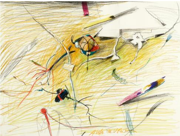
11 Untitled, 2012 © Auke de Vries