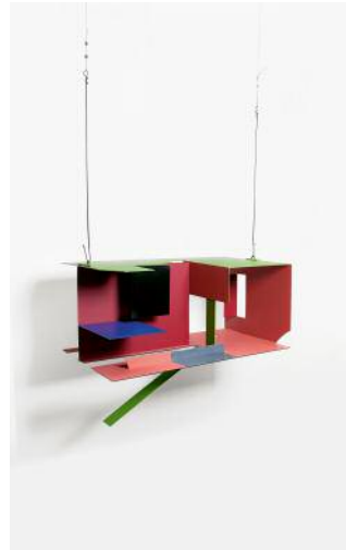
2 Untitled, 2011 © Auke de Vries