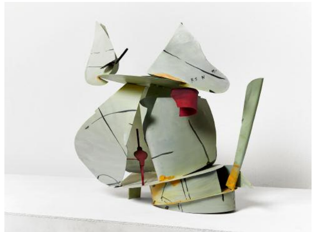
10 Untitled, 2016 © Auke de Vries