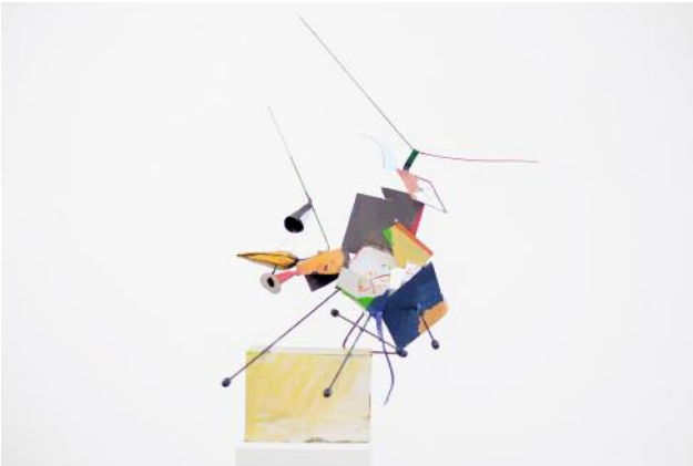
9 Untitled, 2012 Private collection, Cologne © Auke de Vries