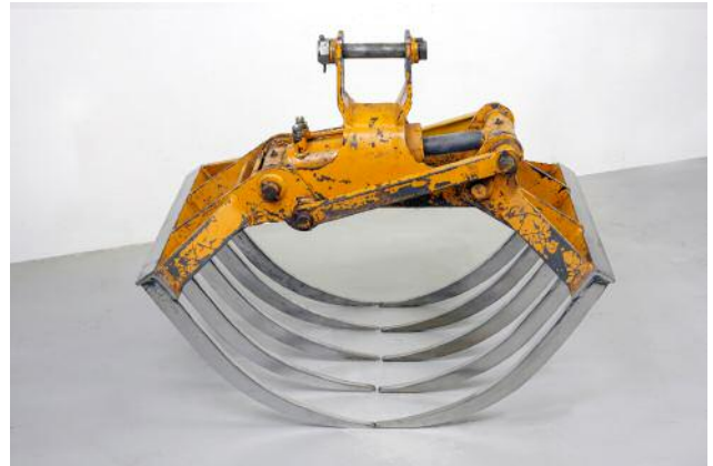
08 Sofia Hultén (*1972, SE / DE), Grin , 2021