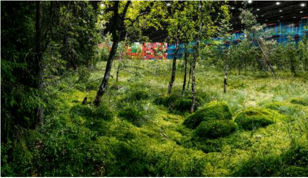
07 Ilkka Halso (*1965, FIN), Container Depot , 2014