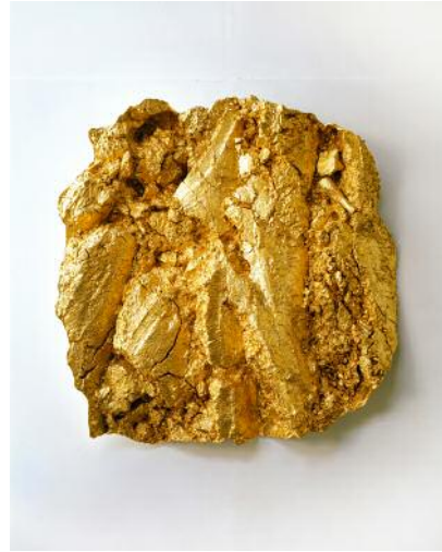
02 Asta Gröting (*1961, DE), Acker 2012 Courtesy the artist and carlier/ gebauer Berlin / Madrid © Asta Gröting, VG-Bild-Kunst, Bonn, 2021. Photo: Nic Tenwiggenhorn