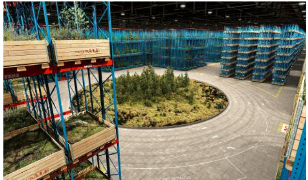
04 Ilkka Halso (*1965, FIN), Roundabout , 2011, Courtesy the artist. Photo: Ilkka Halso