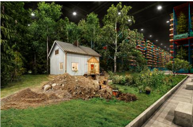
05 Ilkka Halso (*1965, FIN), „ House with Garden “– Unique Opportunity , 2011