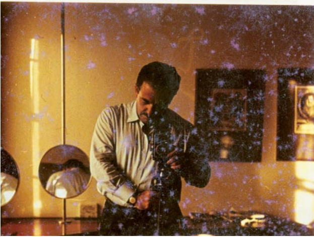
01_