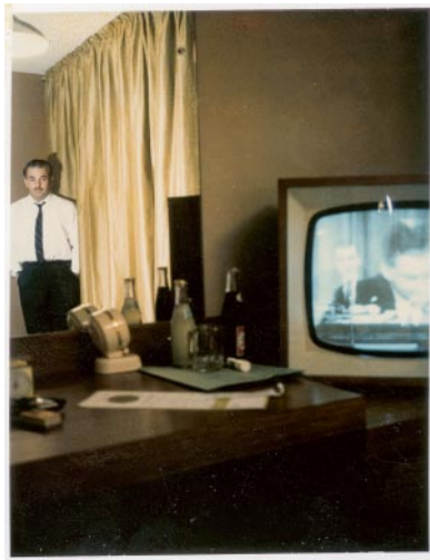
10_ © Dalia Johananoff Kenneth