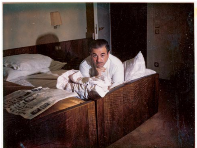
06_