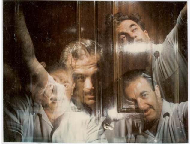
02_