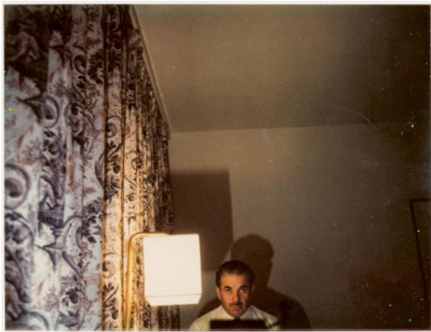
03_