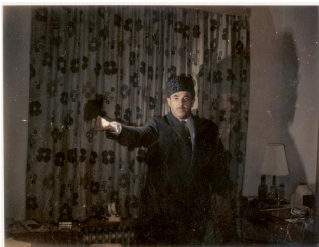
11_