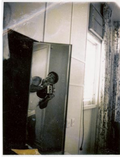
08_