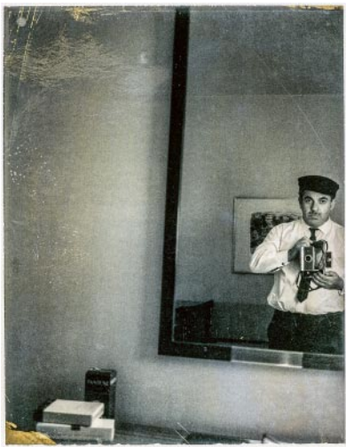
09_