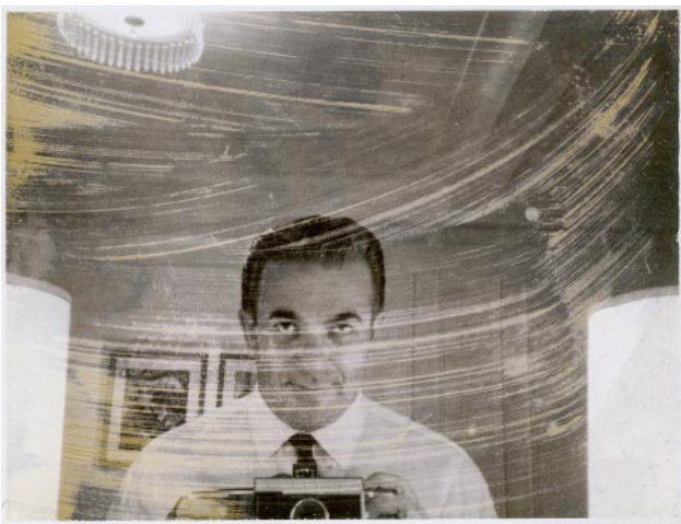
05_