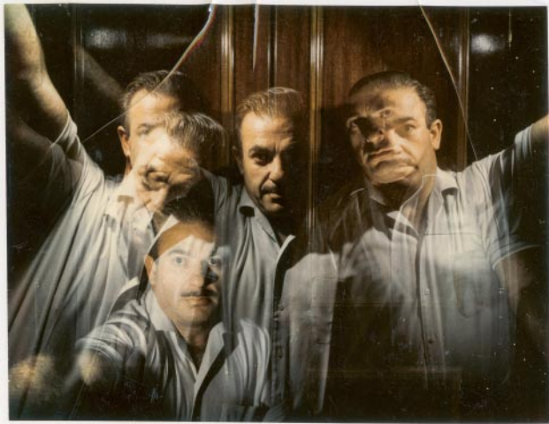
07_