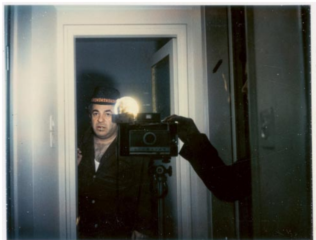
12_