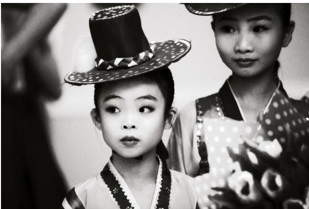
11 © Xiomara Bender