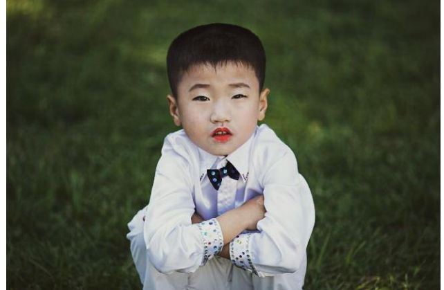
2 © Xiomara Bender