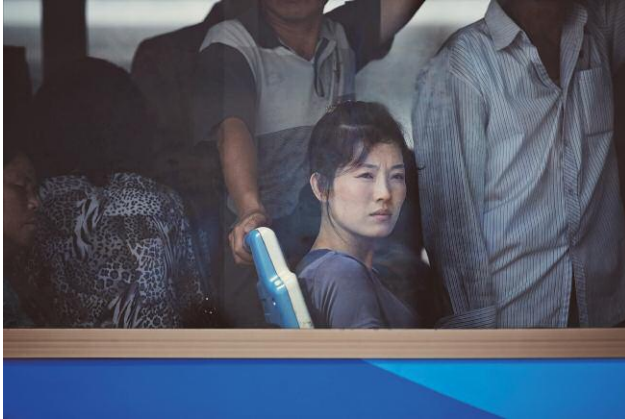
1 © Xiomara Bender