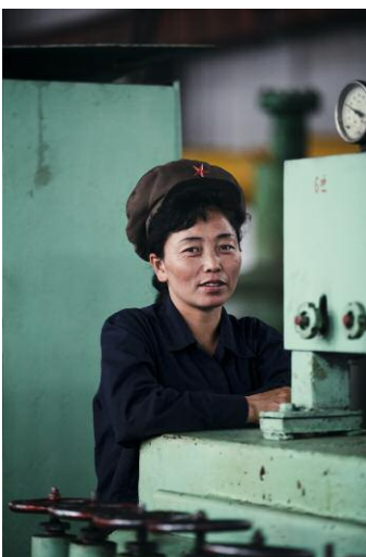
5 © Xiomara Bender