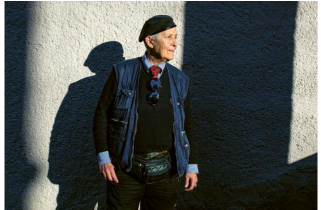
10_ © Anne Ackermann