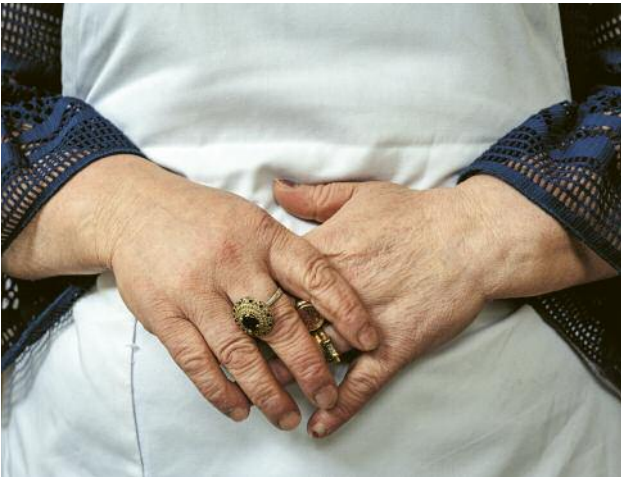
09_ © Anne Ackermann