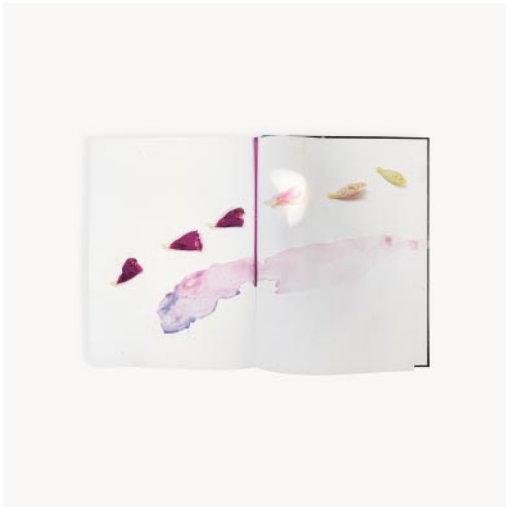
07_ Peace study, petal. 2022