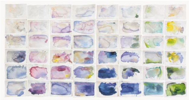
03_ Iris. 2022