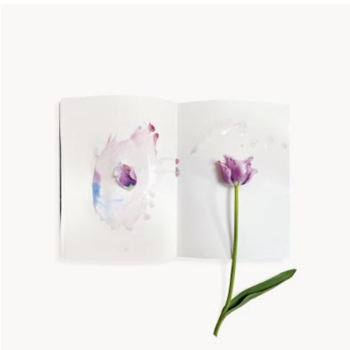
05_ Peace study, blue purple. 2022 © Sarah Schorr