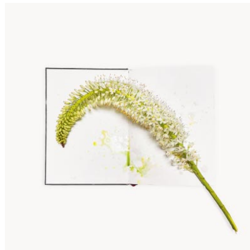
06_ Peace study, pale green. 2022 © Sarah Schorr