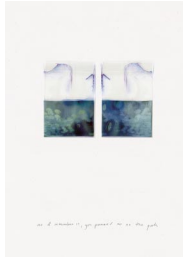
02_ As far I remember. 2022