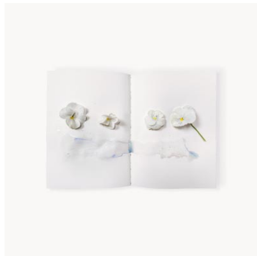
10_ Peace study, white. 2022