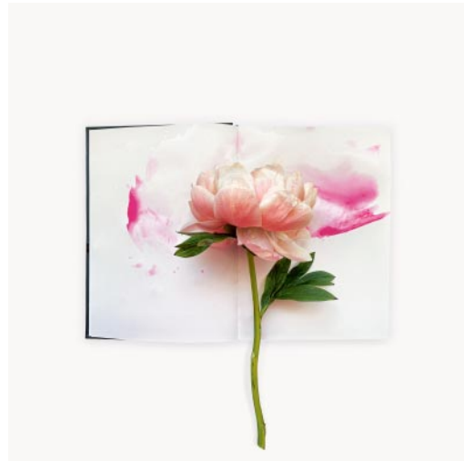
08_ Peace study, peony. 2022 © Sarah Schorr