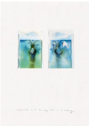
09_ Embraced