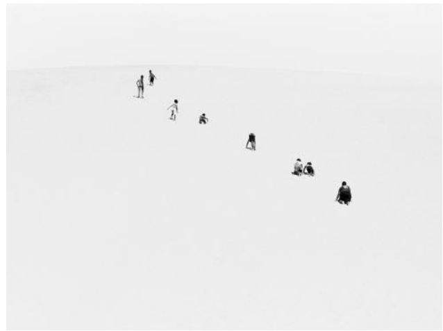
10 Ohne Titel , aus der Serie Omatandangole