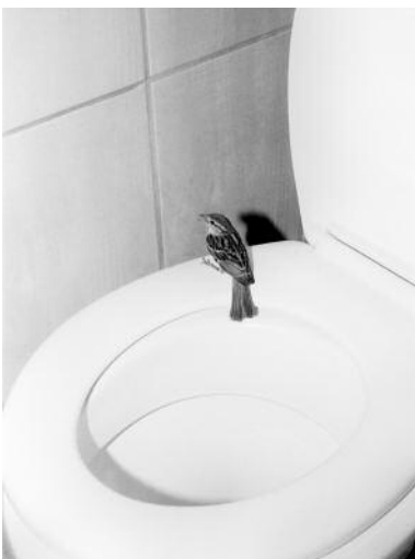
05 Ohne Titel , aus der Serie Omatandangole