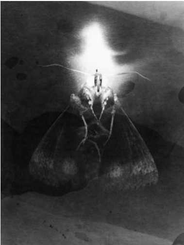
01 Ohne Titel , aus der Serie Omatandangole