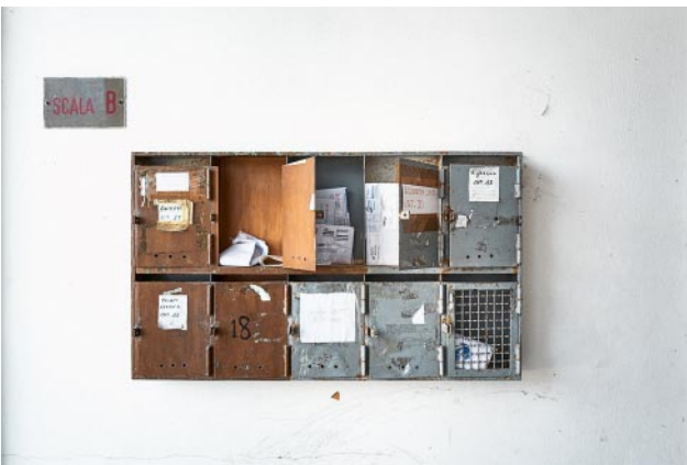
11_ © Alberto Gandolfo