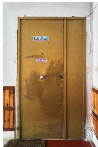
10_ © Alberto Gandolfo