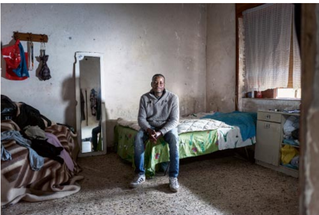
o5_ © Alberto Gandolfo