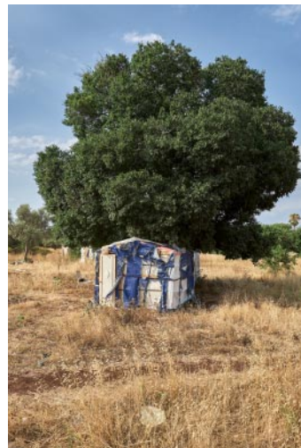
12_ © Alberto Gandolfo