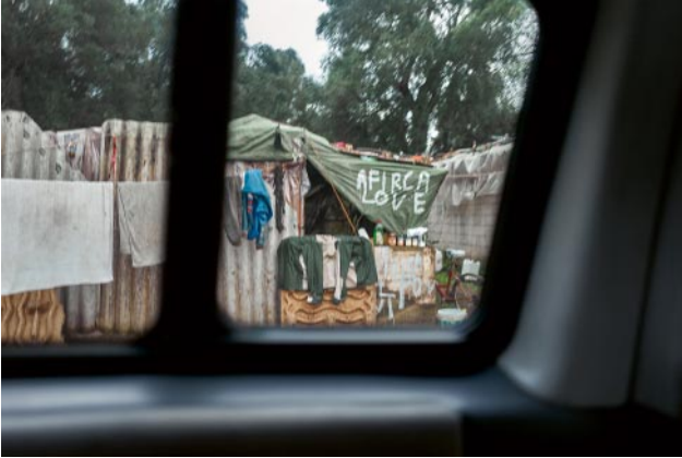
07_ © Alberto Gandolfo