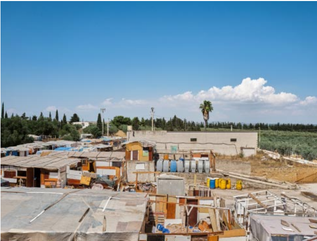
o1_ © Alberto Gandolfo