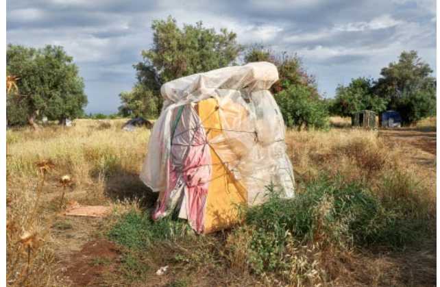
o2_ © Alberto Gandolfo