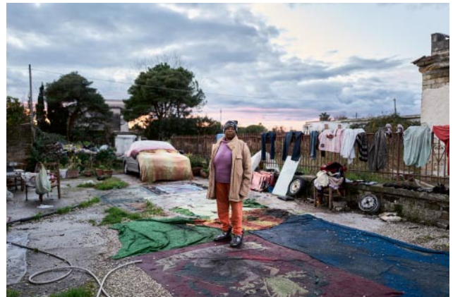
o4_ © Alberto Gandolfo