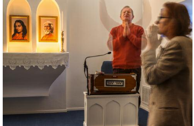
8_ Morning invocation during a retreat at the Self-Realization Fellowship (SRF) hermitage in Encinitas, California.