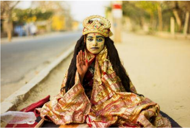
1_ A young devotee blesses pilgrims along the Govardhan parikrama, where Krishna is believed to have spent much of his youth.