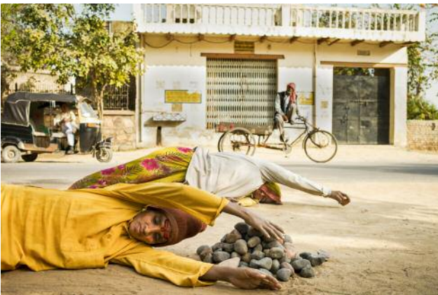
9_ Krishna devotees prostrate during their circumambulation of Govardhan Hill, near Govardhan, India. Moving one stone her body's length with each prostration (of 108 stones), the devotee in the foreground's parikrama, or walk around the sacred hill, will require 12 years to complete. Her bhakti, or devotion to Krishna, keeps her moving forward.