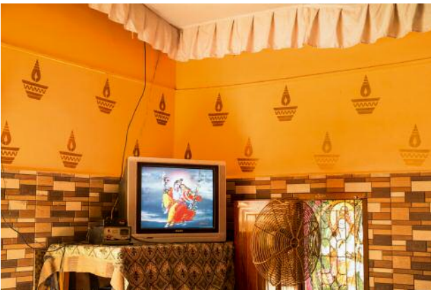
5_Radha and Krishna on the television at Mauni Baba Ashram near Neelkanth, India.