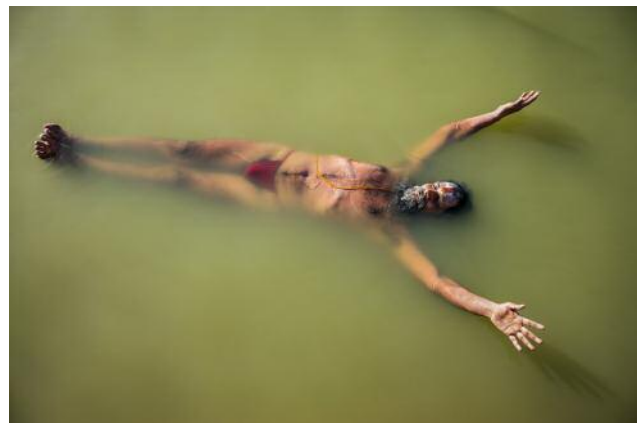
6_ A sadhu practices plavini pranayama while floating on the Shipra River during the Kumbh Mela in Ujjain, India.