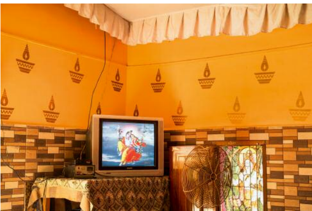
5_ Radha and Krishna on the television at Mauni Baba Ashram near Neelkanth, India.