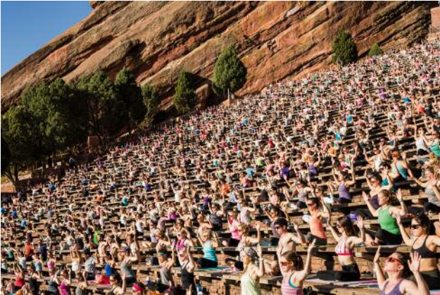
7_ Thousands of yogis practice asana during a early morning class at Red Rocks Amphitheater near Morrison, Colorado. Approximately 3,000 attended the sold out event, "Yoga on the Rocks."