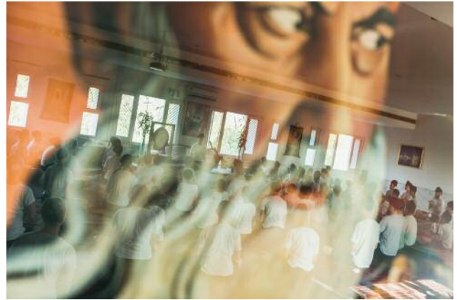
2_Students at Miri Piri Academy in Amritsar, India, practice Kundalini yoga in the reflection of Yogi Bhaijan.