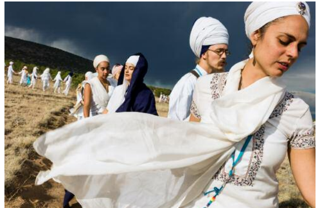
4_Following two and a half days of White Tantric Yoga, yogis in New Mexico take a blind walk through the arid landscape