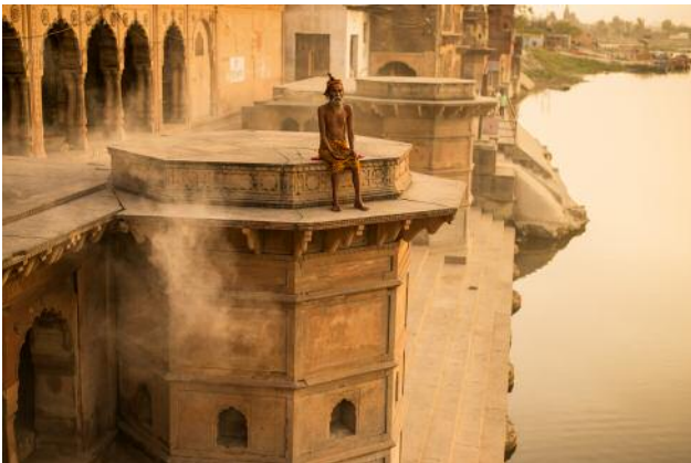
3_Meditation on the Yamuna River at Keshi Ghat in Vrindavan.