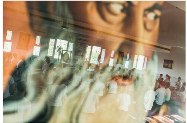
2_ Students at Miri Piri Academy in Amritsar, India, practice Kundalini yoga in the reflection of Yogi Bhajan.