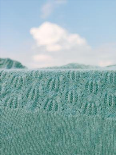
7 Cloud #9689, Frankfurt, 2011