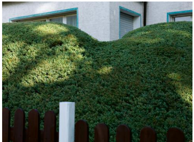
6 Hedge #0445, Oberursel, 20156 © Anja Conrad