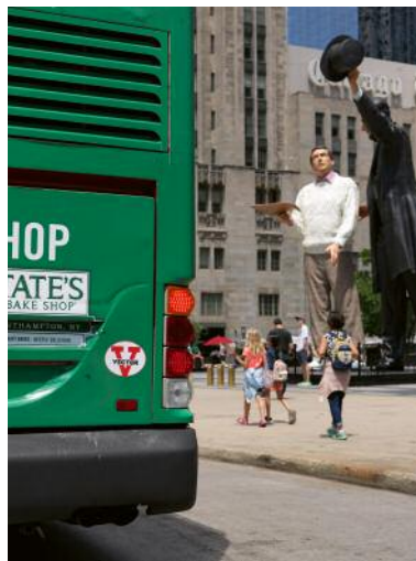
10 Car #3557, Chicago, 2017