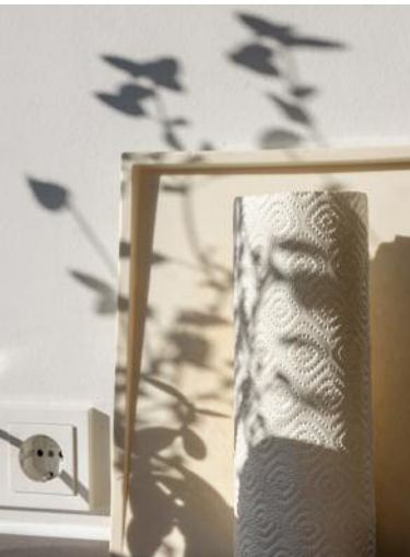
9 Still Life #0542, Oberursel, 2018 © Anja Conrad