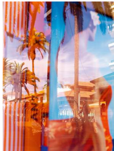
2 Palm Trees #15428, Tenerife, 2012 © Anja Conrad