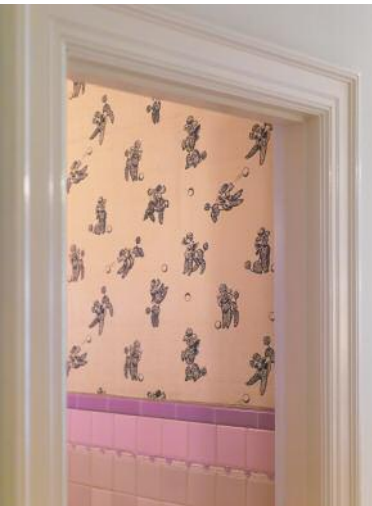
3 Wallpaper #17311, Memphis, 20 © Anja Conrad