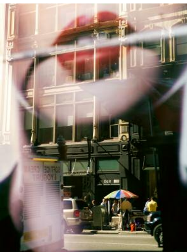
5 Lips #4054, New York, 2010 © Anja Conrad