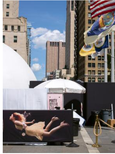
8 Rope Barrier #4550, New York, 2018