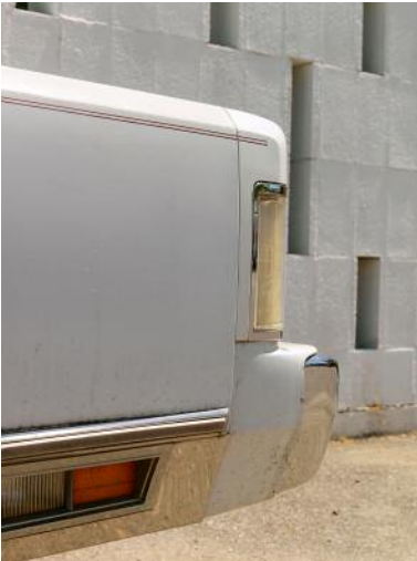
1 Car #17088, Memphis, 2012