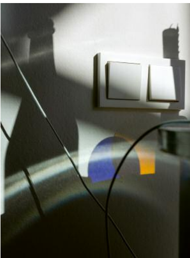
11 Still life #F1625, Oberursel, 2018