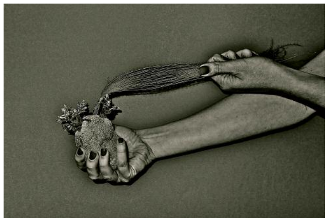
6 © Ann Massal