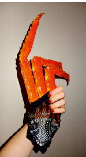
5 © Ann Massal