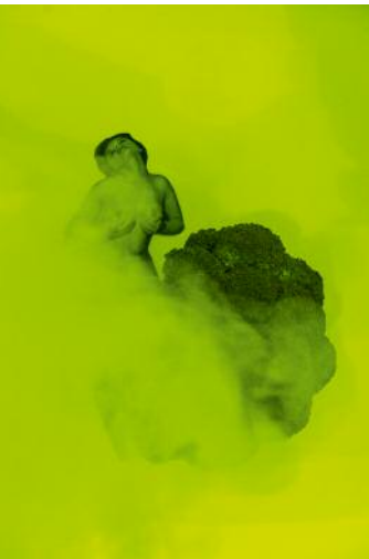
11 © Ann Massal