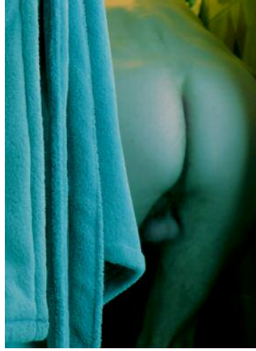
8 © Ann Massal