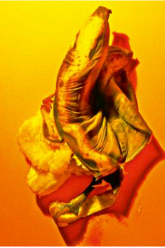
7 © Ann Massal