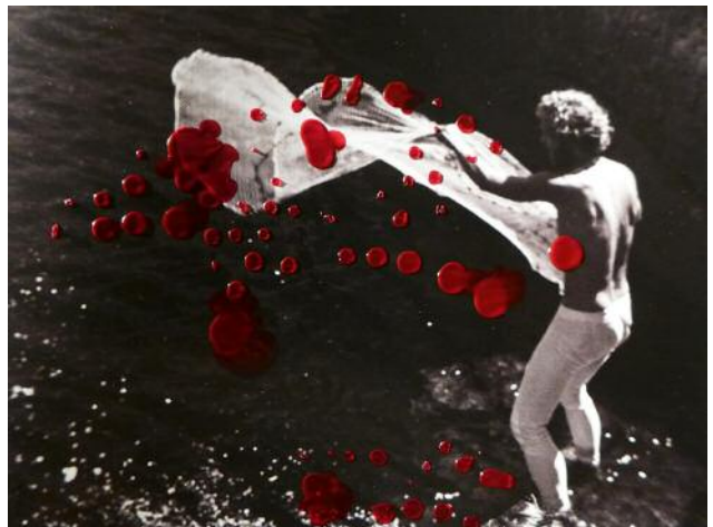
12 © Ann Massal