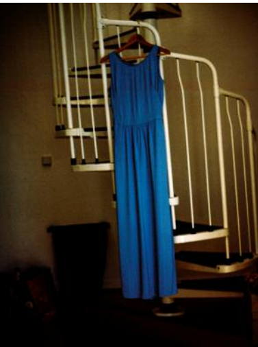
3 One dance