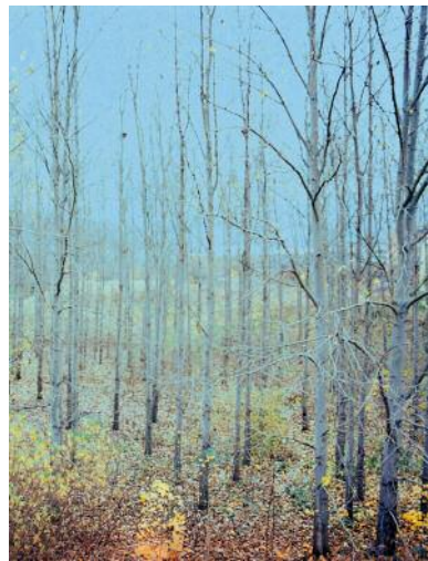
2 Into the woods © Anna Katharina Zeitler