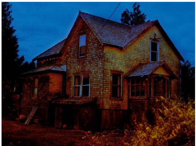
6 Beautiful world