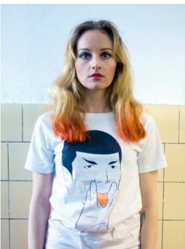
5 Pretty please