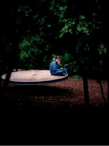
7 Tick of the clock © Anna Katharina Zeitler