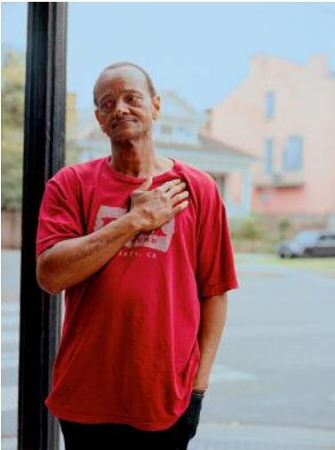
1 Unnamed © Anna Katharina Zeitler