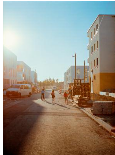
10 Road movie