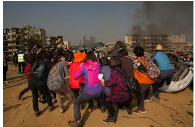
10 Simulation of Tragedy, #27 © Anna Lim