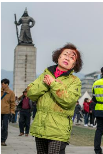
11 Rehearsal of Anxiety, Monologue #24 (L) © Anna Lim