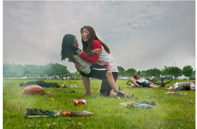
02 Rehearsal of Anxiety, Action #10 © Anna Lim