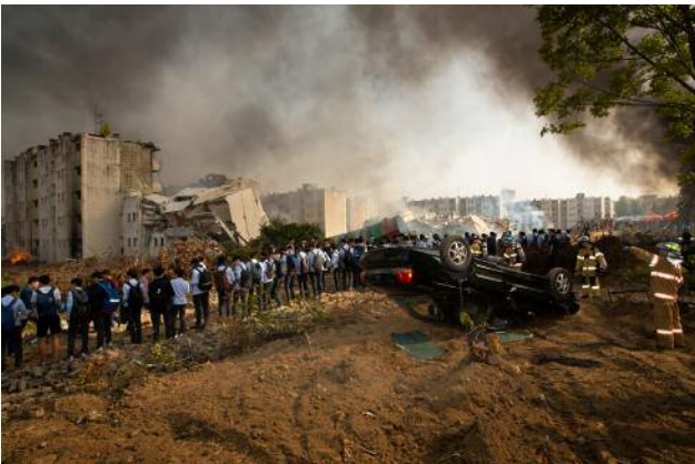
09 Simulation of Tragedy, #4 © Anna Lim