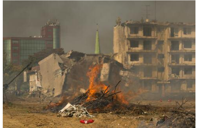
08 Simulation of Tragedy, #3 © Anna Lim