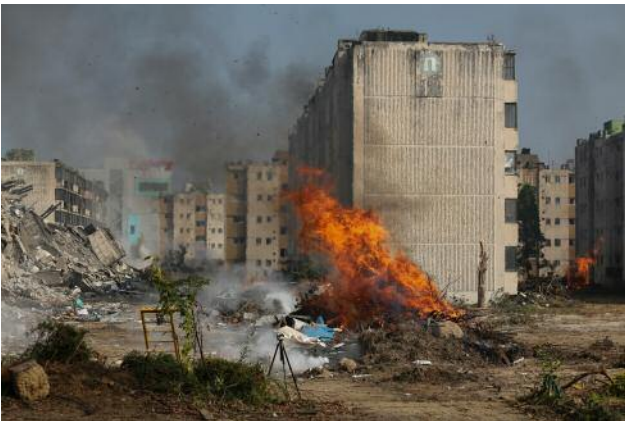
05 Simulation of Tragedy, #6 © Anna Lim