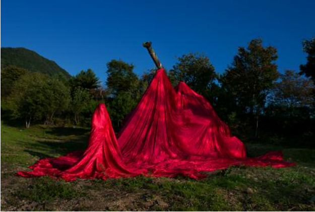
01 Rehearsal of Anxiety, Action #5 © Anna Lim