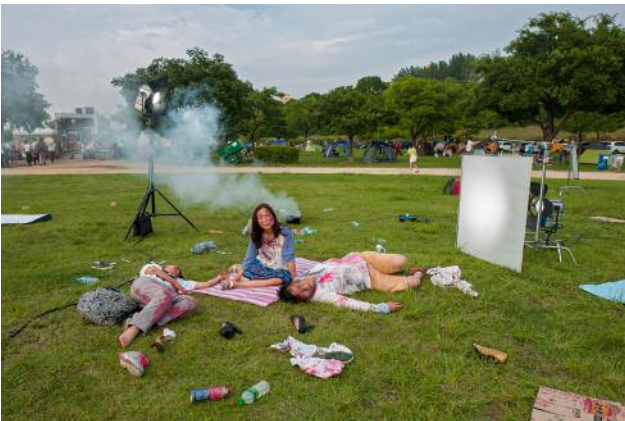
03 Rehearsal of Anxiety, Scene #3