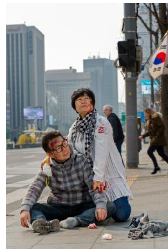
12 Rehearsal of Anxiety, Duet #6 b (R) © Anna Lim