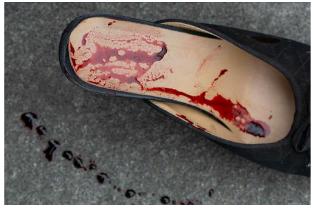
04 Simulation of Tragedy, #5 © Anna Lim