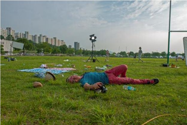
07 Rehearsal of Anxiety, Monologue #35 (L) © Anna Lim