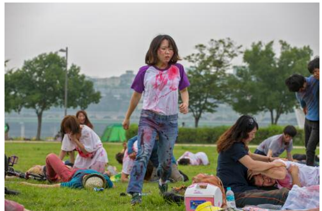
06 Rehearsal of Anxiety, Action #5 © Anna Lim