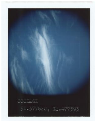
03_Taucha | 0001261 | 51.377620, 12.477593 (EX) from The Blue Skies Project. FP-100C peel-apart instant film