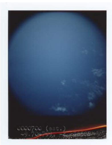
11_Alderney (Kanalinsel) (SS-BB I) | 0000700 (est.) | 49.704799, -2.218568 (EX) from The Blue Skies Project. FP-100C peel-apart instant film