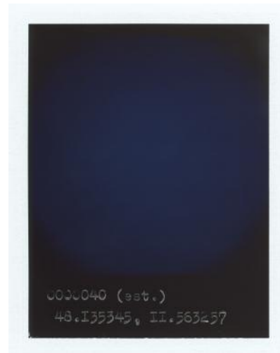
04_München (Lebensborn e.v.) | 0000040 (est.) | 48.135345, 11.563257 (EX) from The Blue Skies Project. FP-100C peel-apart instant film