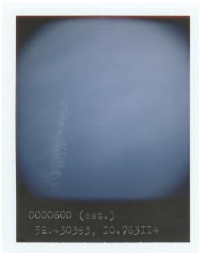
09_Fallersleben | 0000600 (est.) | 52.430393, 10.763114 (EX) from The Blue Skies Project. FP-100C peel-apart instant film