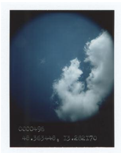
05_Kirchham bei Pocking | 0000496 | 48.363448, 13.282170 (EX) from The Blue Skies Project. FP-100C peel-apart instant film