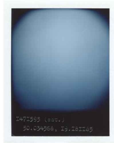
02_Auschwitz II - Birkenau | 1471595 (est.) | 50.034568, 19.181185 (EX) from The Blue Skies Project. FP-100C peel-apart instant film