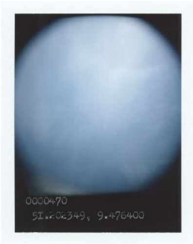
01_Breitenau | 0000470 | 51.202349, 9.476400 (EX) from The Blue Skies Project. FP-100C peel-apart instant film