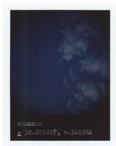
06_'s Gravenhage | unknown | 52.085097, 4.326982 (CO) from The Blue Skies Project. FP-100C peel-apart instant film