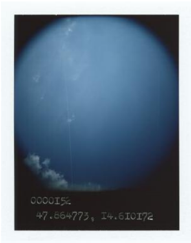
07_Dippoldsau | 0000152 | 47.864733, 14.610172 (EX) from The Blue Skies Project. FP-100C peel-apart instant film