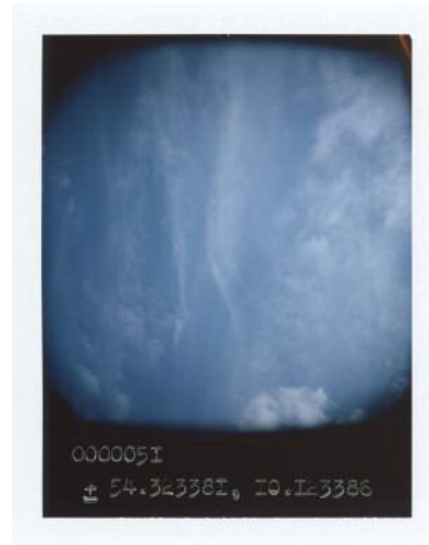
08_Kiel | 0000051 | 54.323381, 10.123386 (CO) from The Blue Skies Project. FP-100C peel-apart instant film