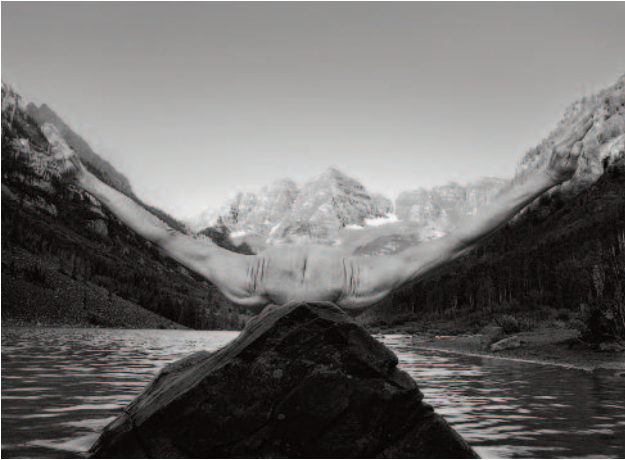
07 Maroon Bells Sunrise, Aspen, Colorado, 2012