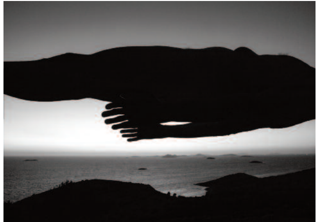
12 Gravity Sleeps, Žirje on the Adriatic, Croatia, 2016