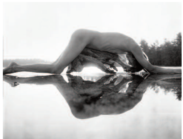
06 Fosters Pond, 2011