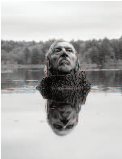
09 King of Fosters Pond, Fosters Pond, 2013 © Arno Rafael Minkkinen