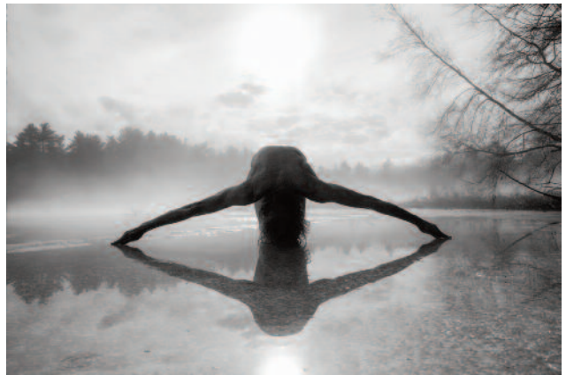
10 Mouth of the River, Fosters Pond, 2014