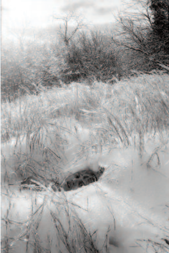
01 Saunderstown, Rhode Island, 1974