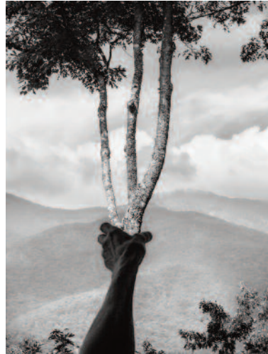
08 Halfway Up Mt. Mitchell, Burnsville, North Carolina, 2013