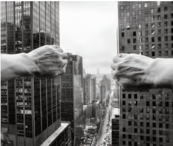
03 From the Shelton, Looking East, New York, 2005 © Arno Rafael Minkkinen