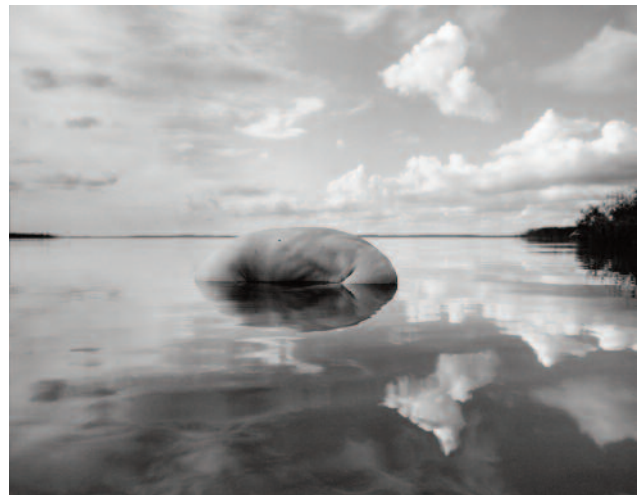
04 Oulujärvi Afternoon, Paltaniemi, Kajaani, Finland, 2009