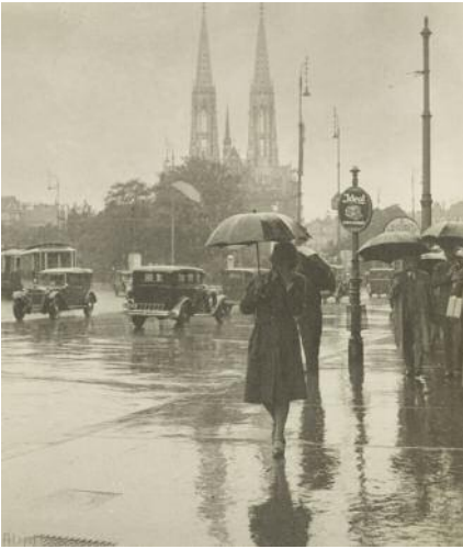
13_Franz Holluber, Auf der Schottengasse , 1931