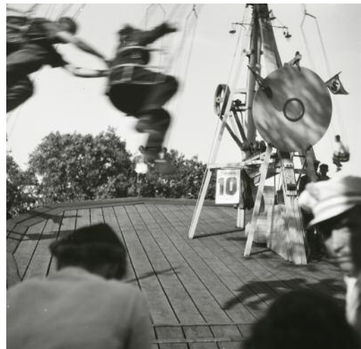
10_ Robert Haas, Kettenkarussell , aus der Serie: Böhmischer Prater , 1938