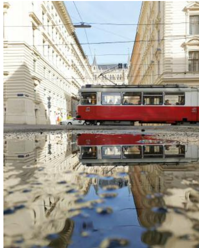
16_@lukas_pellmann, Puddle Bim , 2020 © Wien Museum