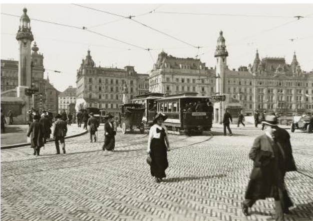
05 Unbekannt, An der Ferdinandsbrücke, Wien , um 1911