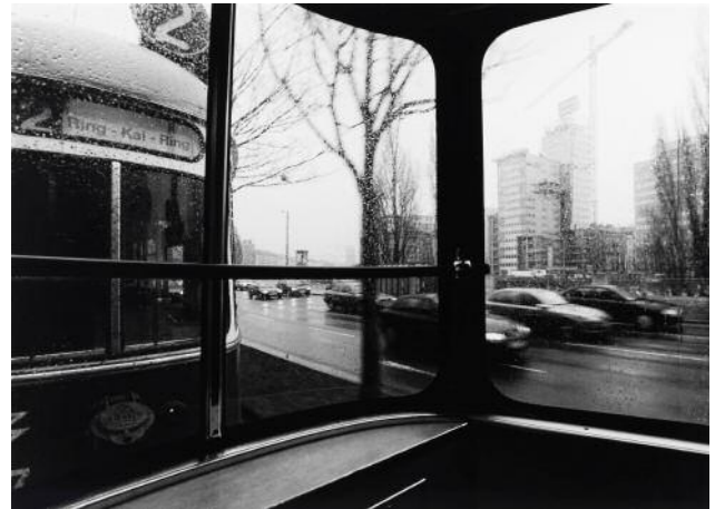
08_ Reinhard Mandl, Am Franz-Josefs-Kai , 2000 © Wien Museum