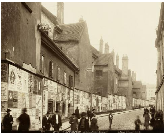
09_ August Stauda, In der Kaserngasse (heute Otto-Bauer-Gasse) , um 1902