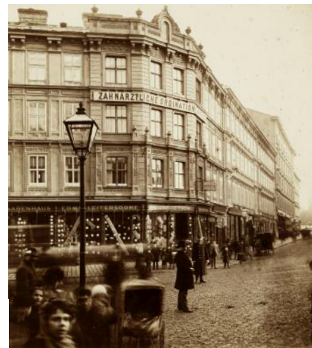
04 Michael Frankenstein & Comp, Blick in die Währinger Straße, Wien , um 1880 © Wien Museum