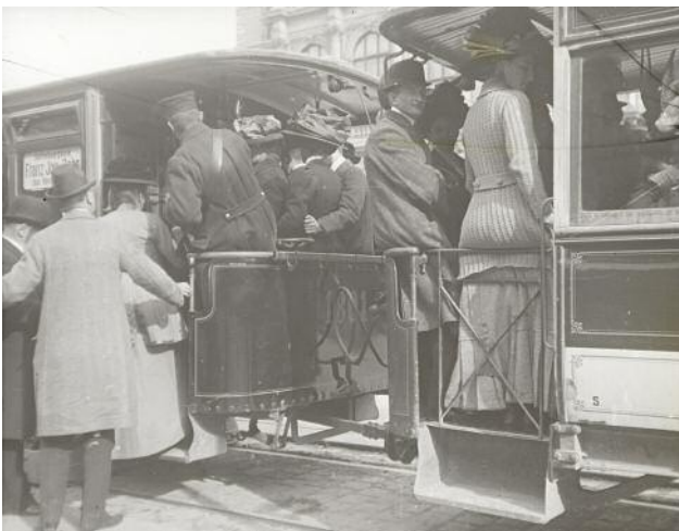
03 Emil Mayer, Auf der Straßenbahn, Wien , um 1900