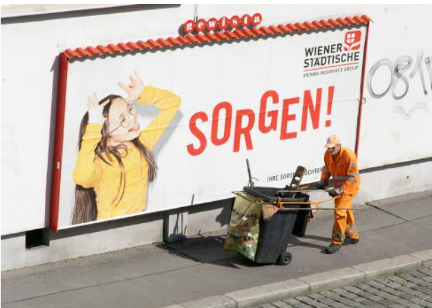
17_@nelo_ruber, Clash of Generations , 2020