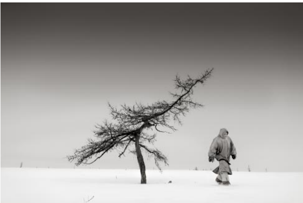
11_Aleksandr in der Tundra, Sibirien, 2016