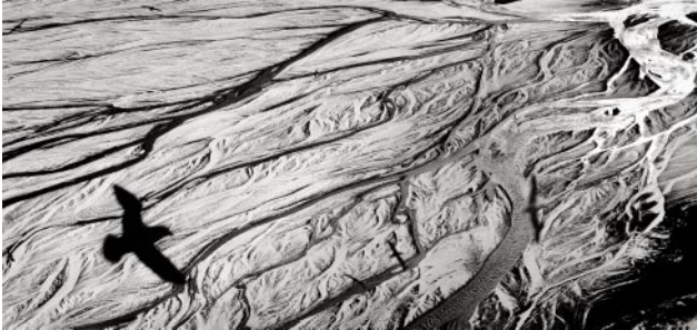
01_Mýrdalssandur, Iceland, 1996