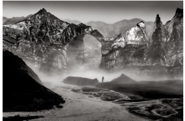
08_Köttljökull-Schmelze, Island, 2021