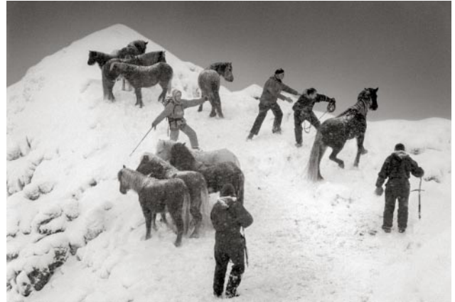
02_Pferderettung, Skarðsheiði, Island, 199