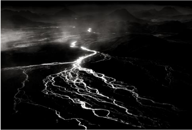
07_Gletscherfluss, Hochland, Island, 2020