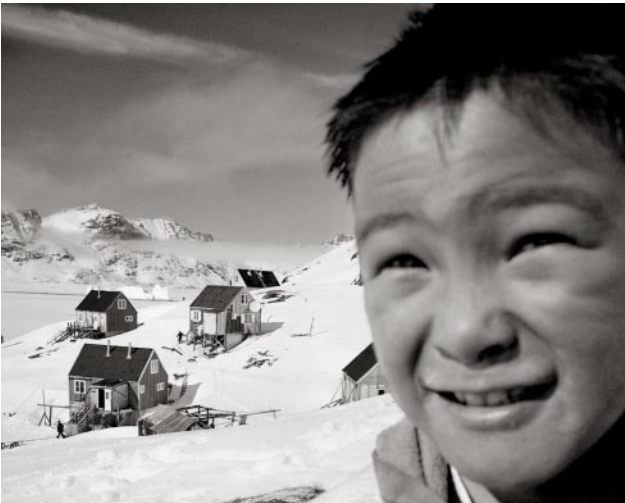
09_Sermiliqaaq, Grönland, 1997 © Ragnar Axelsson