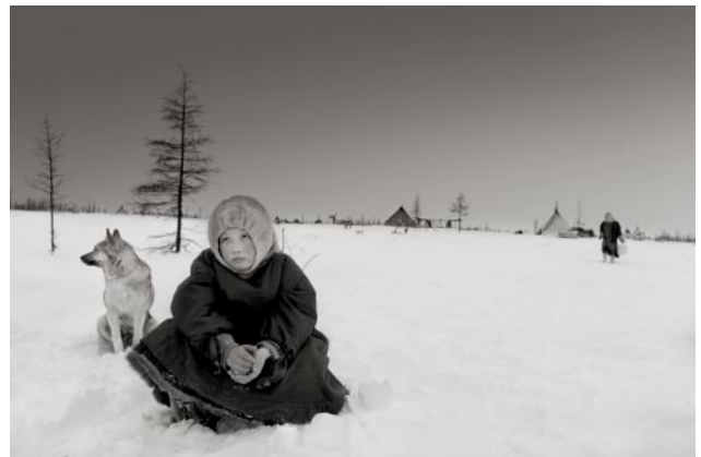
12_Nenets Camp, Sibirien, 2016