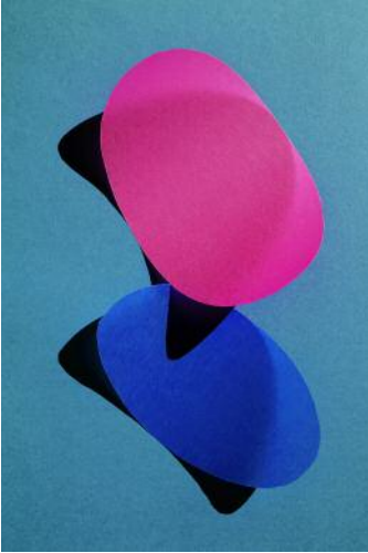
07 cut out 21