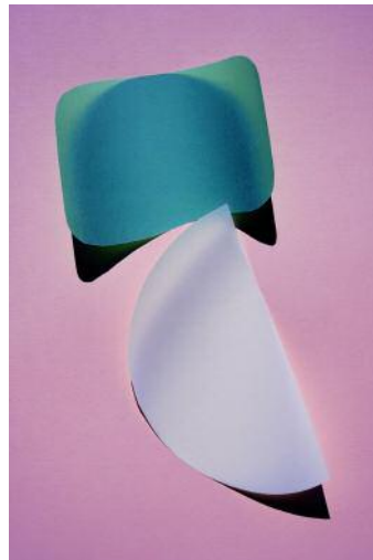
02 cut out 11 © Jessica Backhaus