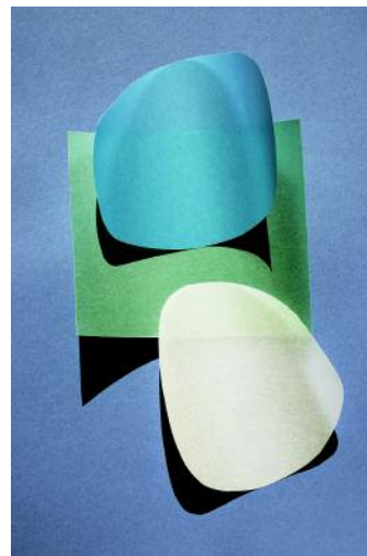
10 cut out 35 © Jessica Backhaus