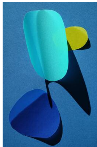
12 cut out 44