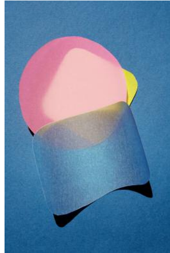
08 cut out 25