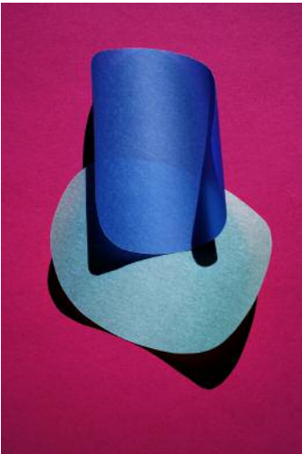
03 cut out 12 © Jessica Backhaus