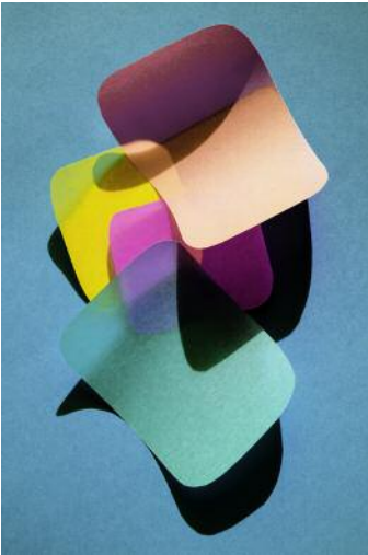
01 cut out 6