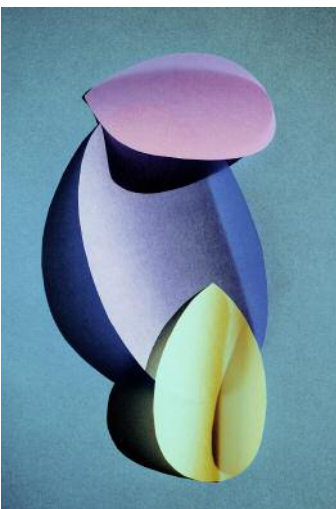
11 cut out 40