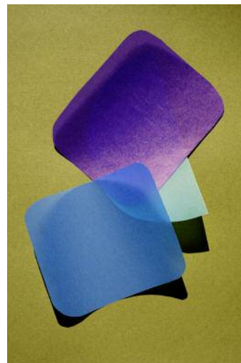
06 cut out 20