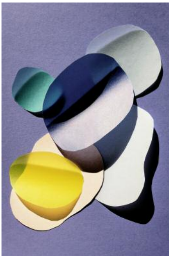
05 cut out 16 © Jessica Backhaus / VG Bild-Kunst, Bonn