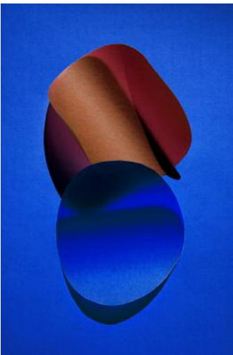
09 cut out 26