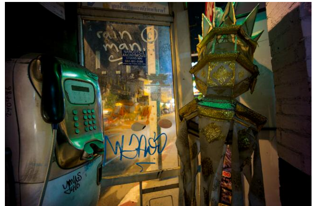
08 Rain Man