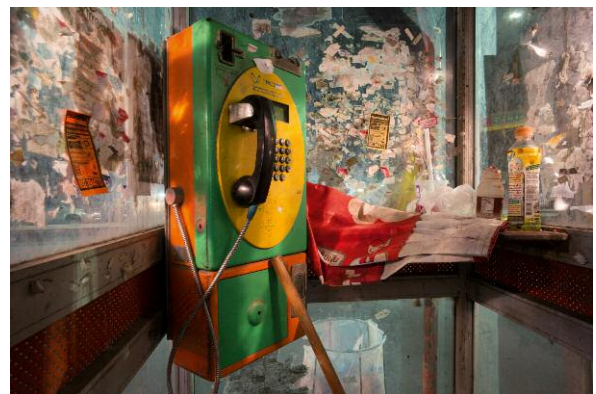
10 Yellow Bottle