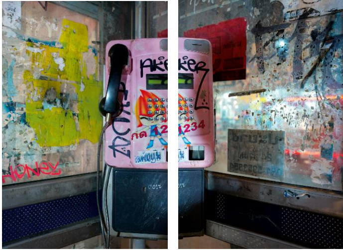
06 Pink Aker (Diptychon) © Frank Hallam Day