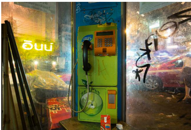
04 Red Milk Carton