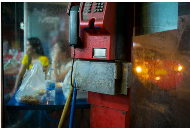
09 Yellow Shirt, Blue Table © Frank Hallam Day