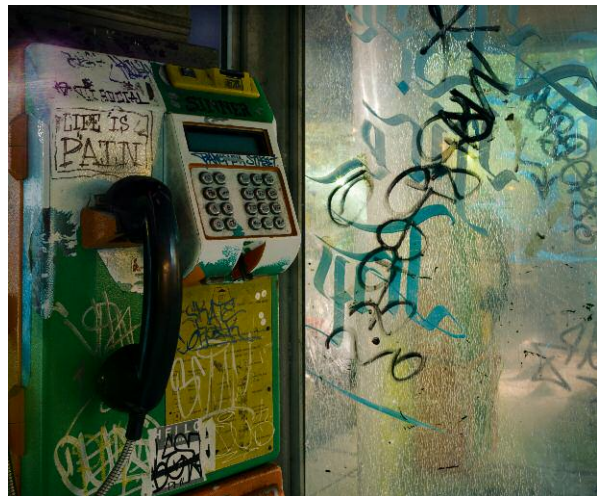
03 Life is Pain