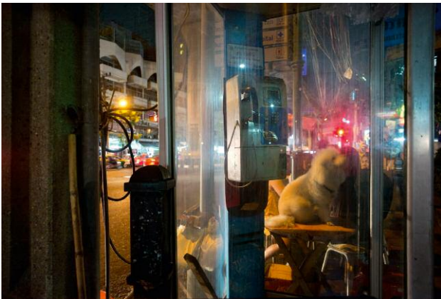
07 Poodle, Nana