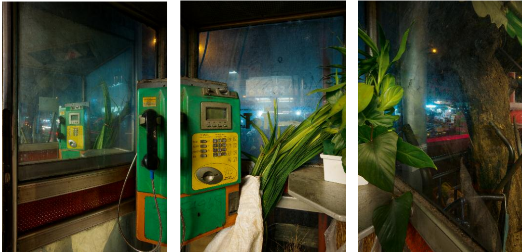
01 Flower Market (Triptychon) © Frank Hallam Day