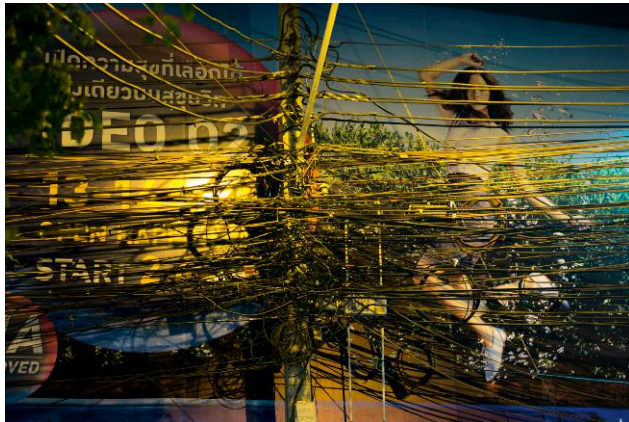
02 Girl with Cables © Frank Hallam Day