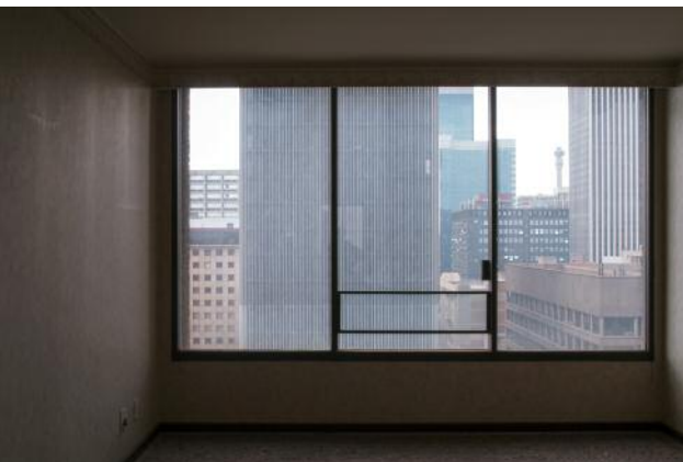
11_ © Yvonne Mueller & Leif Bennett