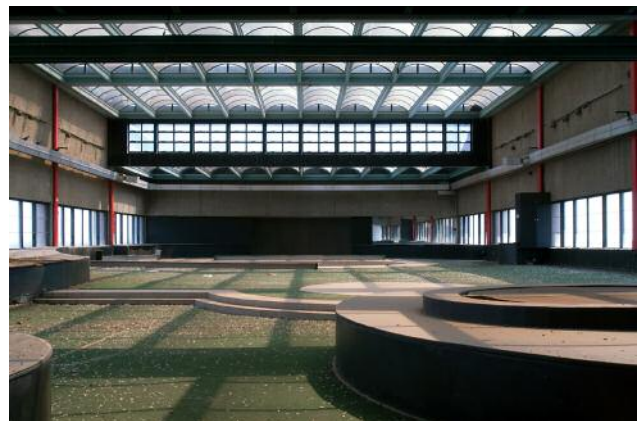
12_ © Yvonne Mueller & Leif Bennett