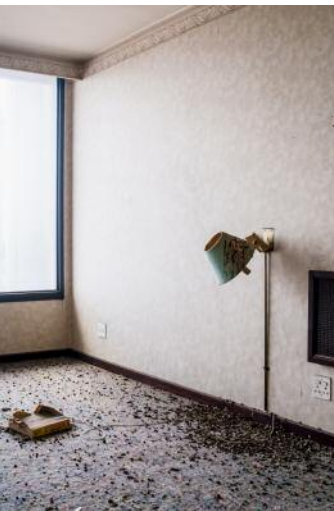
9_ © Yvonne Mueller & Leif Bennett