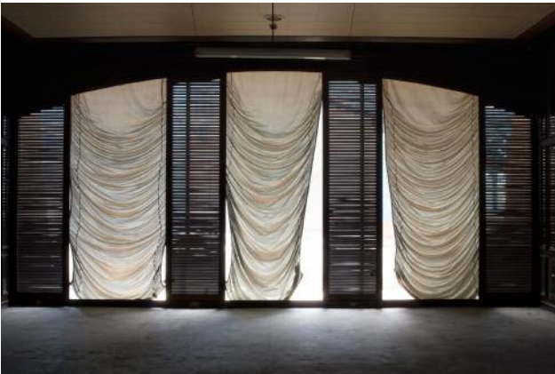
3_ © Yvonne Mueller & Leif Bennett