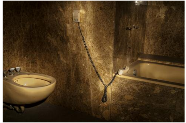
8_ © Yvonne Mueller & Leif Bennett