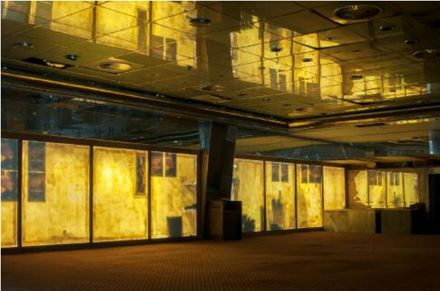
1_ © Yvonne Mueller & Leif Bennett