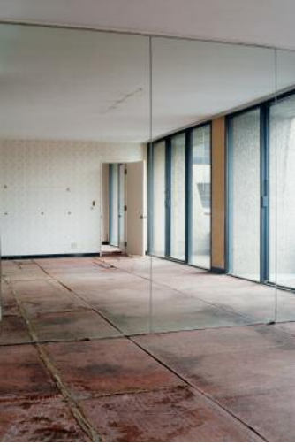
7_ © Yvonne Mueller & Leif Bennett