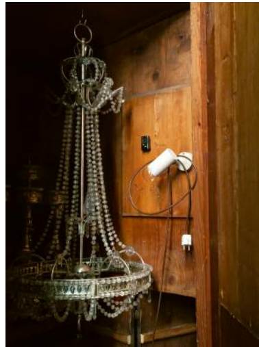
2 © Mira Bergmüller, VG Bild-Kunst, Bonn