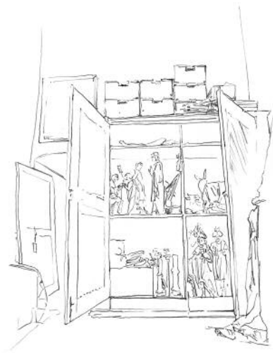
9 © Mira Bergmüller, VG Bild-Kunst, Bonn