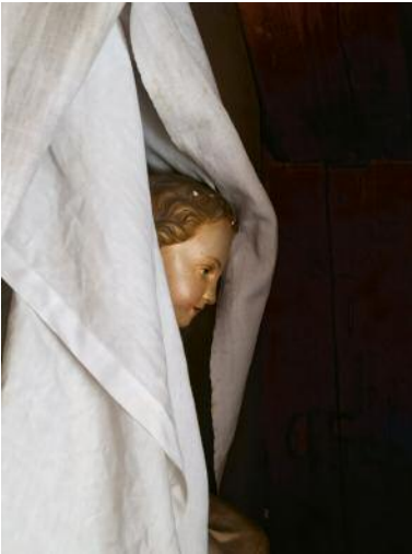
1 © Mira Bergmüller, VG Bild-Kunst, Bonn