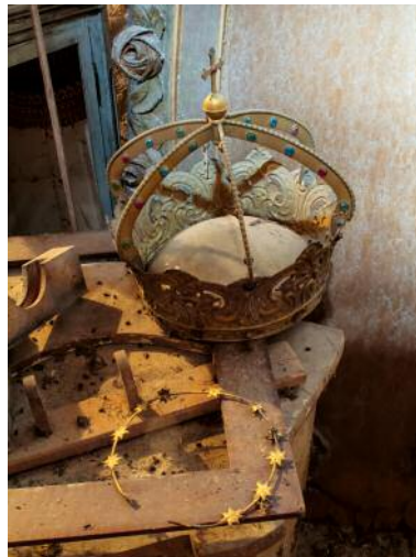
4 © Mira Bergmüller, VG Bild-Kunst, Bonn