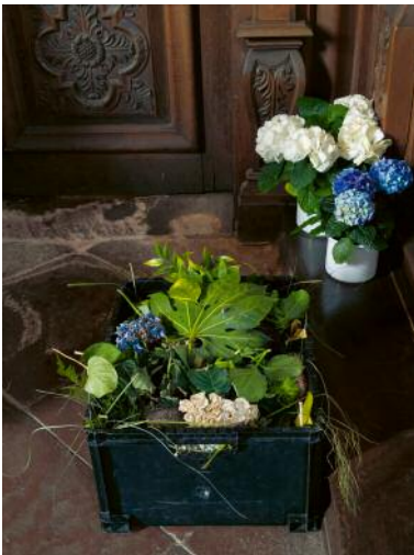
3 © Mira Bergmüller, VG Bild-Kunst, Bonn