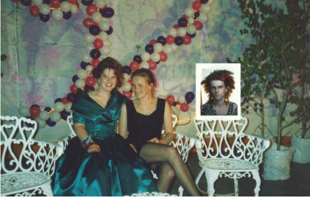
7 © Ada Bligaard Søby