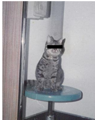
12 © Ada Bligaard Søby