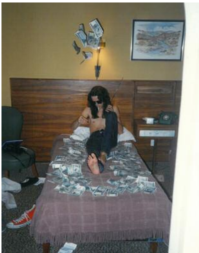
11 © Ada Bligaard Søby