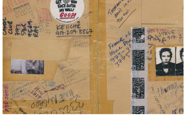
8 © Ada Bligaard Søby