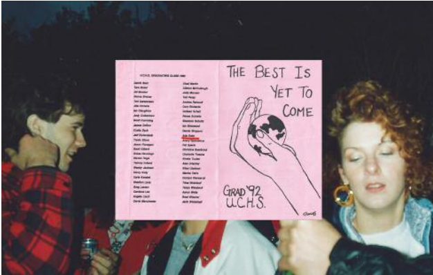
1 © Ada Bligaard Søby