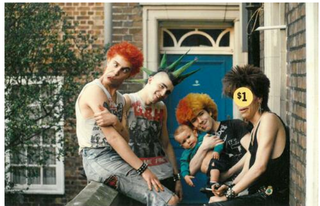
6 © Ada Bligaard Søby