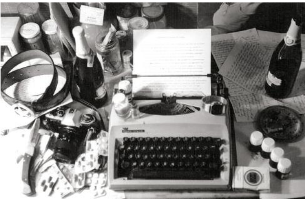
9 © Ada Bligaard Søby