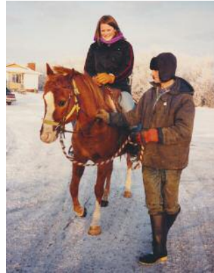
2 © Ada Bligaard Søby