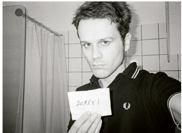
4 © Ada Bligaard Søby