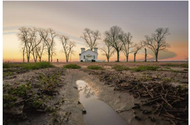
02_Brooklyn Chapel, Money, Mississippi, 2018