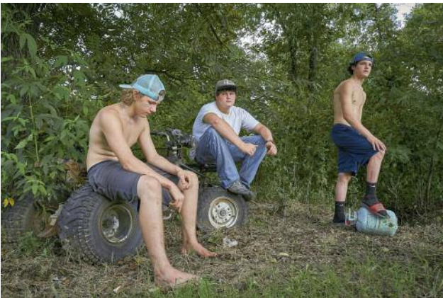
03_Friends, Crowder, Mississippi, 2016