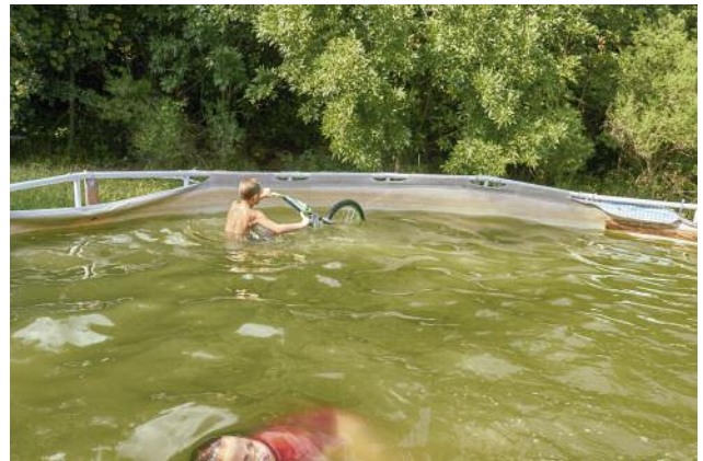
04_Afternoon bike ride, Crowder, Mississippi, 2016