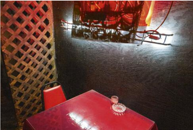
07_Table for one at Wee Jay's, Clarksdale, Mississippi, 2014