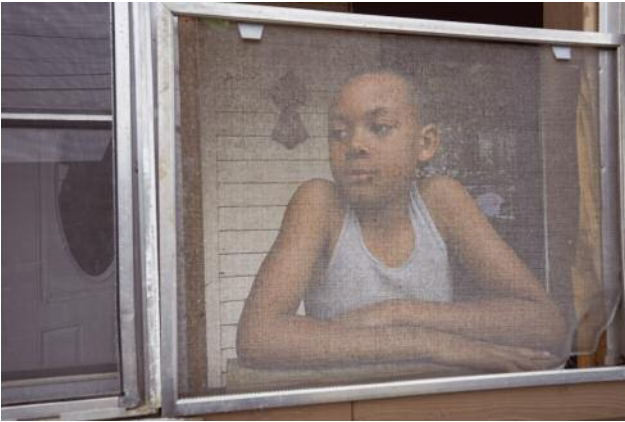
01_Sunday morning, Vicksburg, Mississippi, 2018