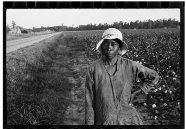
12_Cotton picker, Pulaski County, Arkansas, 1935 (archival photo) © Ben Shahn, photographer, and Library of Congress, U. S. Farm Security Administration, Office of War Information Photograph Collection