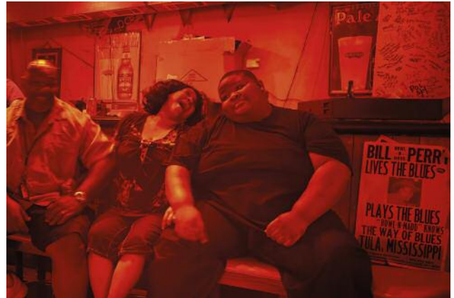
08_Night at Red's, Clarksdale, Mississippi, 2014