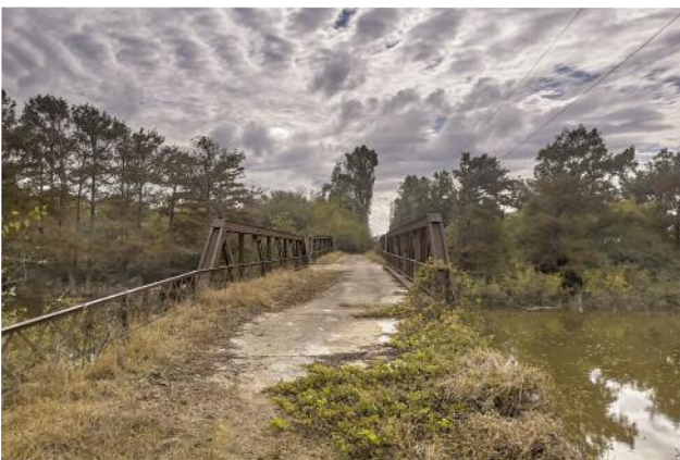
11_Black Bayou Bridge, Glendora, Mississippi, 2021