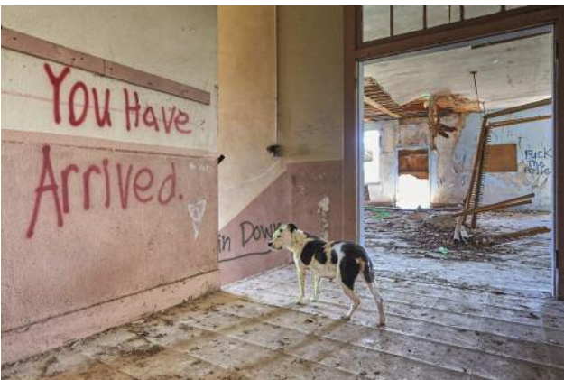
05_You have arrived, Bolton, Mississippi, 2018 © Bob Newman