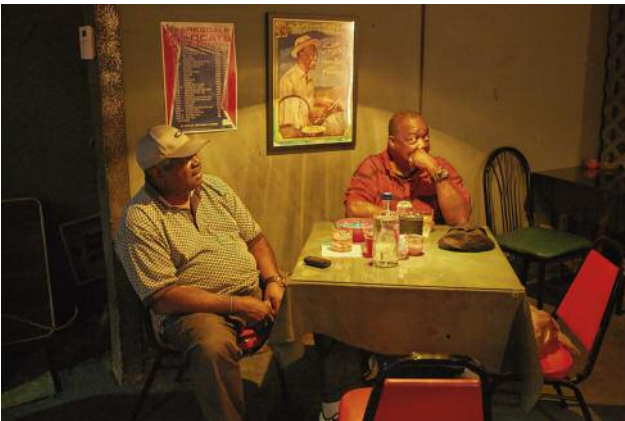
09_House party at Wee Jay's, Clarksdale, Mississippi, 2014