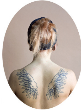
8. Kathryn