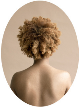
7. Jasmine