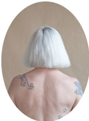
5. Zoe © Tara Bogart