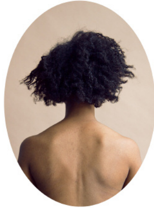
4. Saige © Tara Bogart