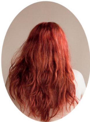
3. Clemence