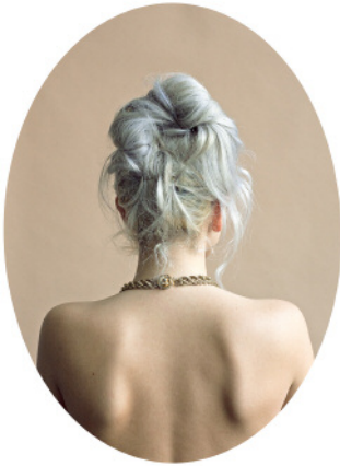
1. Devon © Tara Bogart