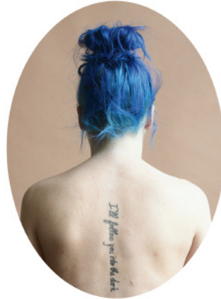
6. Sinead