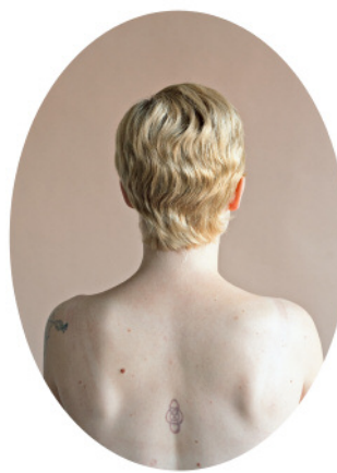
12. Jessie