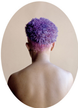
9. Alexis