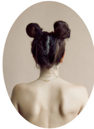
2. Devon © Tara Bogart