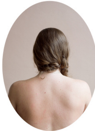
10. Lauren