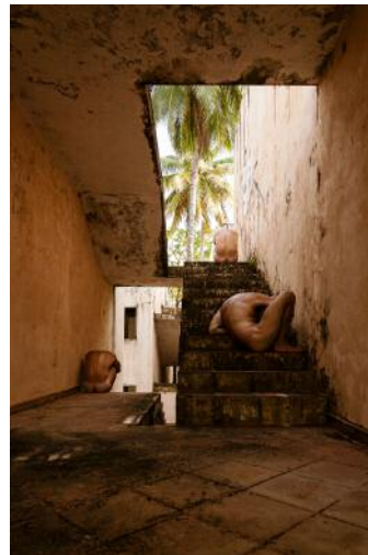
06_Ahmad Naser Eldein From Body and Space series