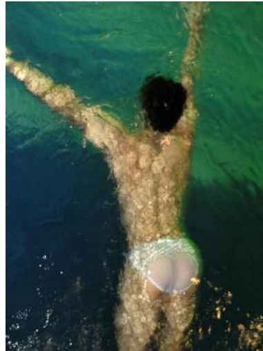
10_Ashish Gupta Watercolour