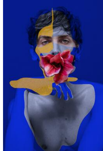
02_Domenico Cennamo Colorgraphy N°20 / Colorgraphy N°12