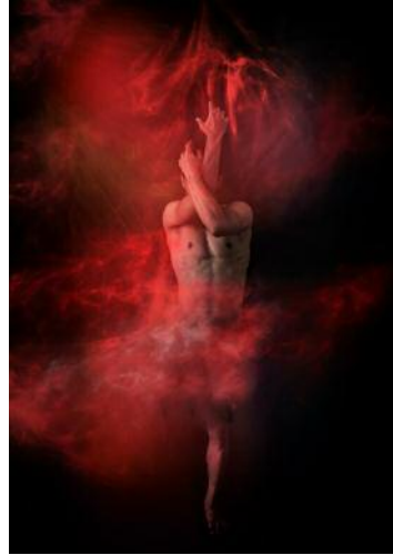
08_Babak Haghi Thunderbolt