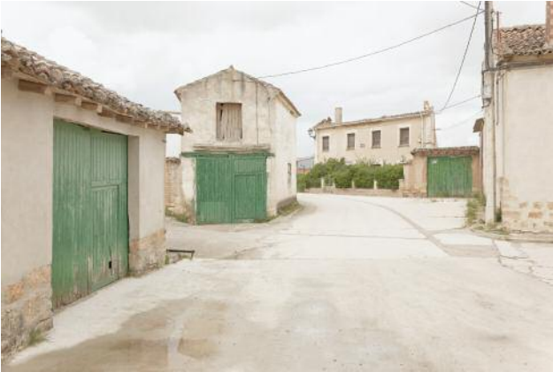
1_Topophilia III, Spain, 2016 © Peter Braunholz, VG Bild-Kunst, Bonn 2017