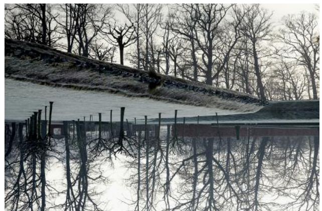
12_Diametral I, Germany, 2012 © Peter Braunholz, VG Bild-Kunst, Bonn 2017