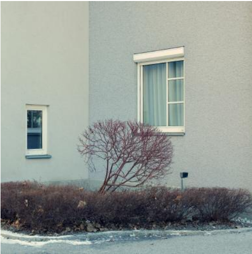
7_Ecke I, Bad Hofgastein, 2016