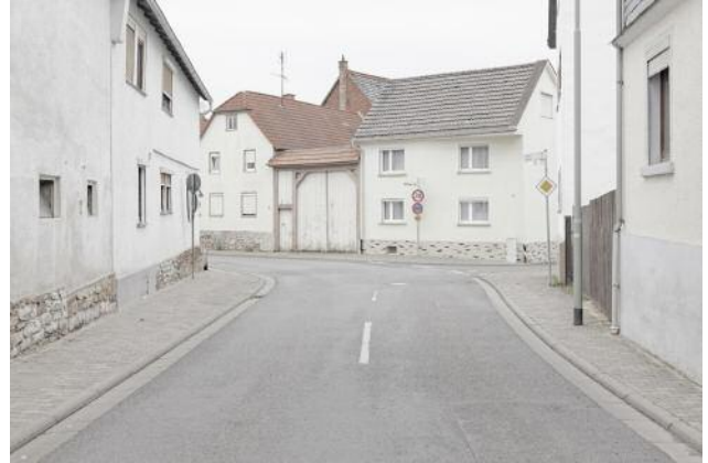
2_Topophilia IV, Germany, 2016