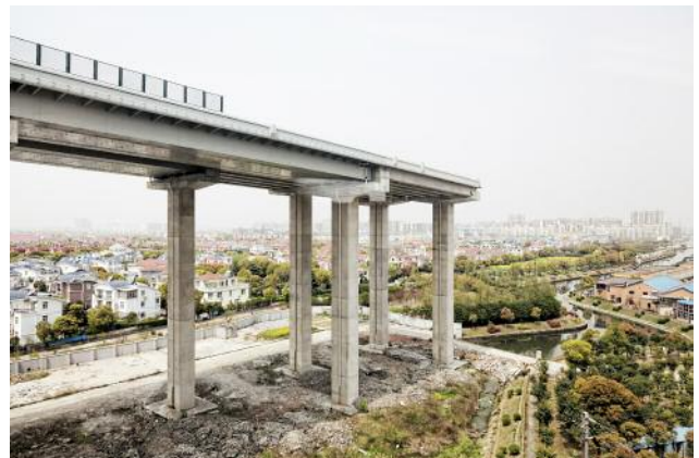
6_Dead End Highway, China, 2013