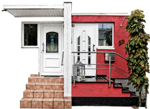
9_Individualization III, Frankfurt am Main, 2014 © Peter Braunholz, VG Bild-Kunst, Bonn 2017