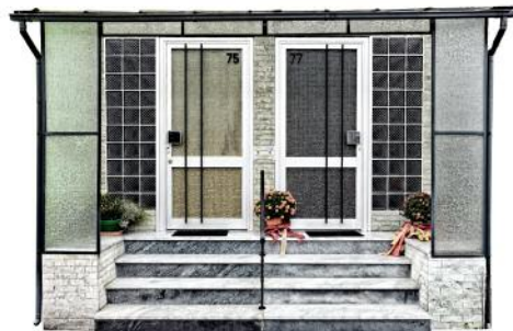
10_Individualization IV, Frankfurt am Main, 2014