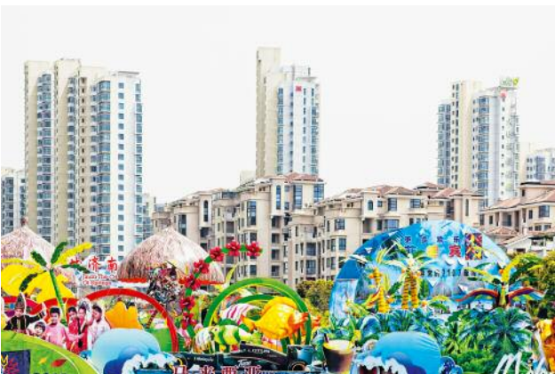
5_Chinese Dreams, Suzhou, 2013