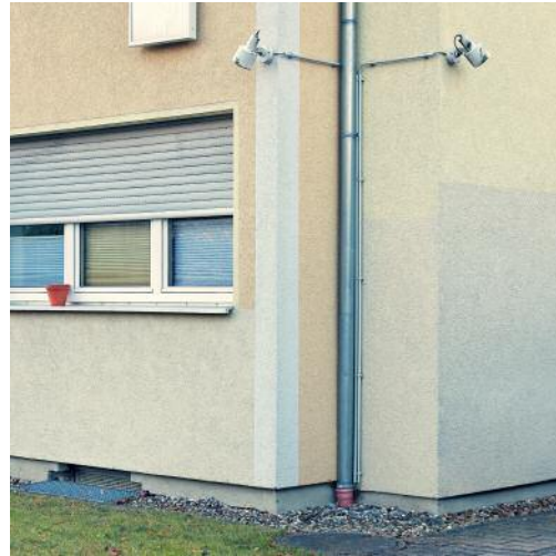
8_Ecke II, Kronberg im Taunus, 2017 © Peter Braunholz, VG Bild-Kunst, Bonn 2017