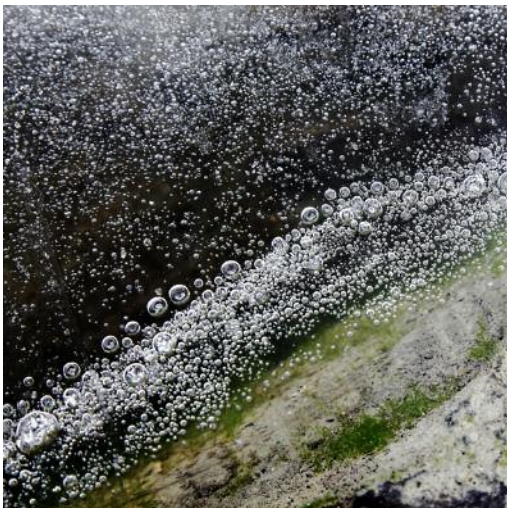
11_Spheres I, Bad Hofgastein, 2009 © Peter Braunholz, VG Bild-Kunst, Bonn 2017