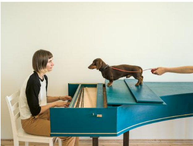
11 Flux Harpsichord Concert, 2017 (nach: George Maciunas, 12 Compositions for Piano – for Nam June Paik, 1962, Composition no. 5: Place a dog or a cat (or both) inside a piano and play Chopin; und nach: Flux-Harpsichord Konzert, Akademie der Künste, Berlin, organised by René Block, Sept. 3, 1976)