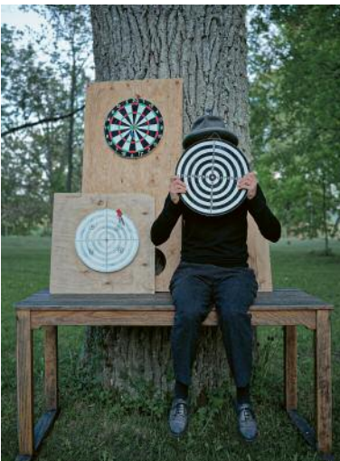
05 Beuys as Target, 2023 © Elina Brotherus / VG Bild-Kunst, Bonn 2023