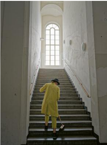
03 Beuys Sweeping Stairs (Kunstakademie), 2023 © Elina Brotherus / VG Bild-Kunst, Bonn 2023