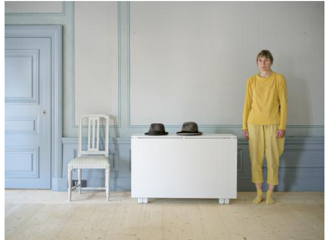
02 Two Hats 2, 2023