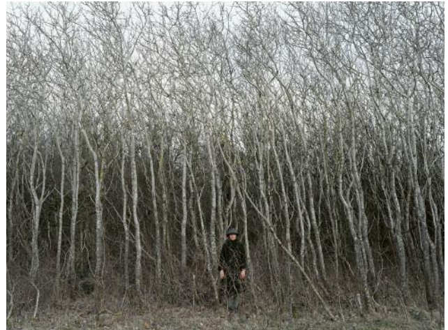
08 Pattern Forest, 2017 © Elina Brotherus / VG Bild-Kunst, Bonn 2023