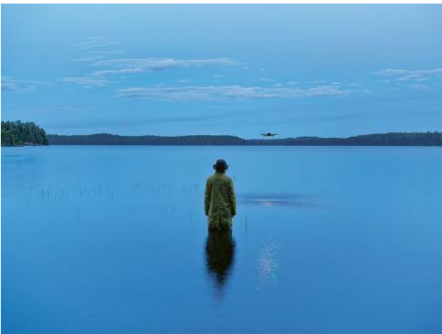
09 Beuys with Drone, 2023