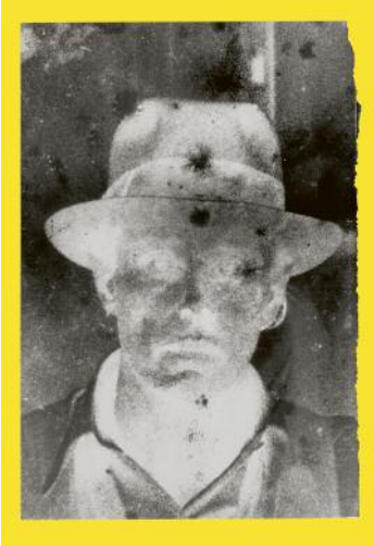
01 Ute Klophaus, Porträt Joseph Beuys, undatiert © bpk/Stiftung Museum Schloss Moyland/ Leihgabe der Ernst von Siemens Kunststiftung