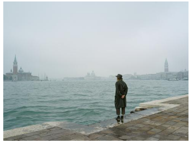
10 Beuys in Venice (the Missing Picture), 2022 © Elina Brotherus / VG Bild-Kunst, Bonn 2023