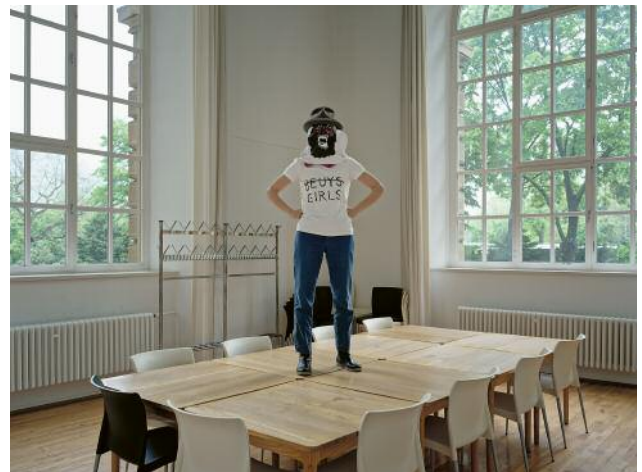
06 Beuys with Guerilla Girls (Free International University), 2023 © Elina Brotherus / VG Bild-Kunst, Bonn 2023