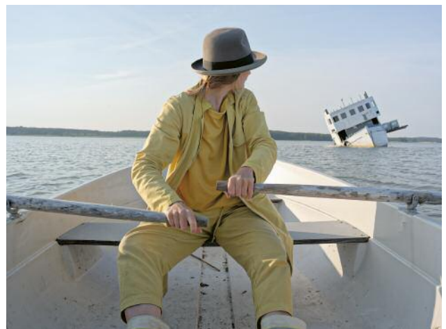
12 Beuys with Shipwreck, 2023 © Elina Brotherus / VG Bild-Kunst, Bonn 2023