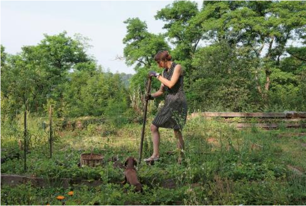
07 Kartoffellese, 2016 (nach: Joseph Beuys, Kartoffelpflanzen, 1977) © Elina Brotherus / VG Bild-Kunst, Bonn 2023