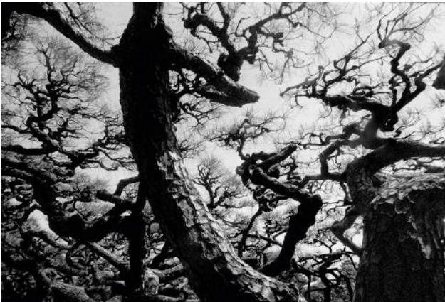
05 Five-hundred-years-old Kuromatsu tree. Japan, Ishikawa Prefecture