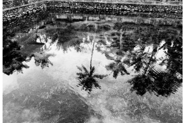
06 This pool is fed by underground spring water that is believed to have healing powers. Indonesia, Bali