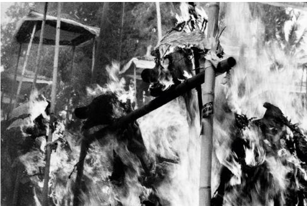
09 In an atmosphere of joy and celebration, collective cremations are a public affair. Indonesia, Bali