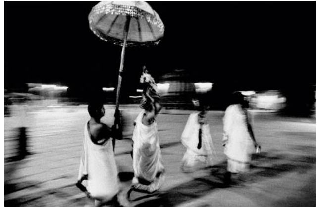
08 Final steps of a night procession before Brahmin priests start a long retreat of silence and abstinence. India, Karnataka