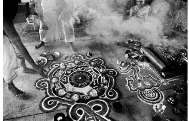
04 Mandalas, symbols of impermanence, are constructed with single grains of sand and destroyed by the flick of a hand. India, Karnataka