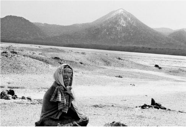
01 The clothed stone statue guarantees a peaceful journey to another world. Japan, Aomori Prefecture