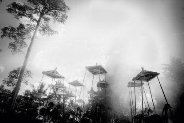
07 Canopies and animal-shaped effigies linger on after a cremation ceremony. Indonesia, Bali