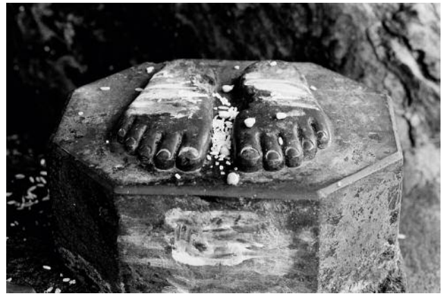
02 The ritual of touching feet is a gesture of respect and welcome for a guest or passing stranger. India, Sankeshwar