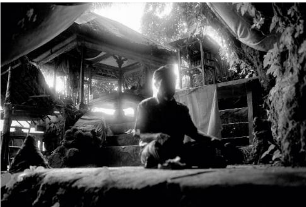
03 The eternal sage guards the peace of this sanctuary without walls. Indonesia, Bali