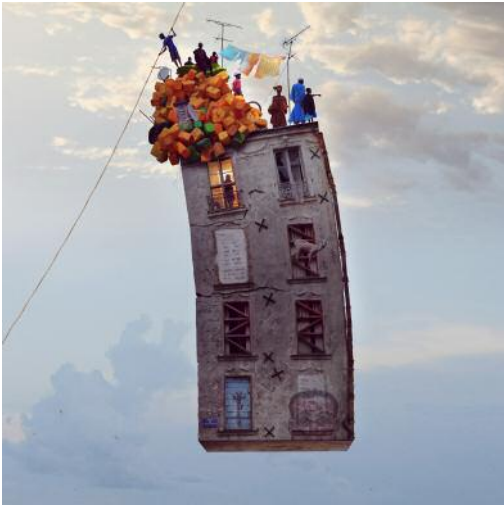
1 THE GRAND ILLUSION / La Grande Illusion