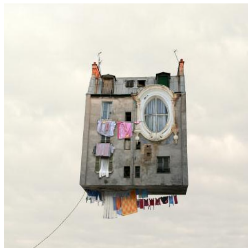
6 THE LOWER DEPTHS / Les Bas-fonds © Laurent Chéhère