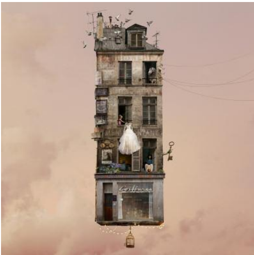
3 A SPECIAL DAY / Le Grand Jour © Laurent Chéhère