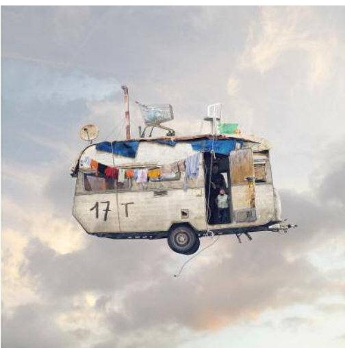
5 THE CARAVAN / La Caravane © Laurent Chéhère