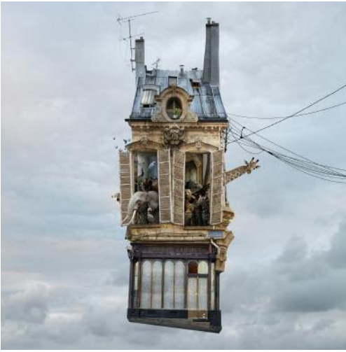
7 STILL LIFE / Nature Morte