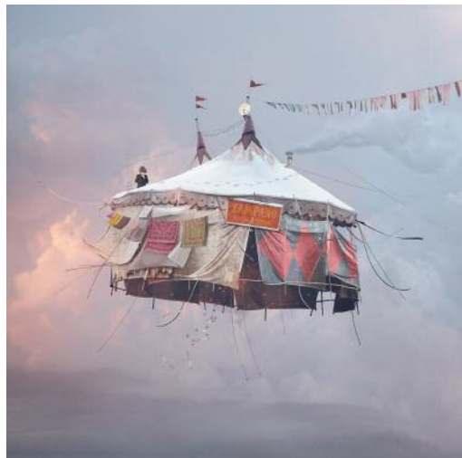
4 THE CIRCUS/ Le Cirque