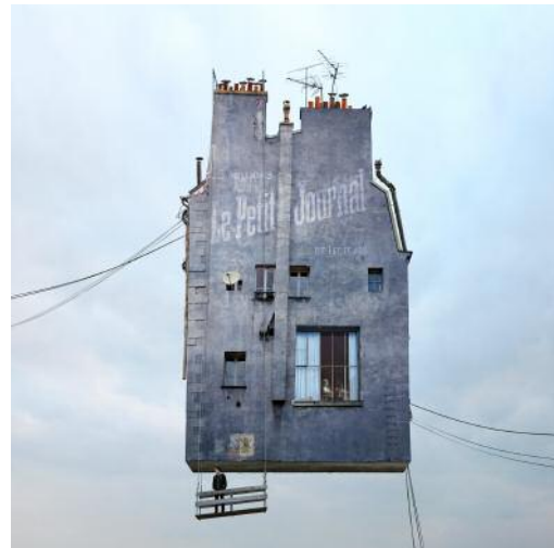
2 THE PETIT JOURNAL / Le Petit Journal © Laurent Chéhère