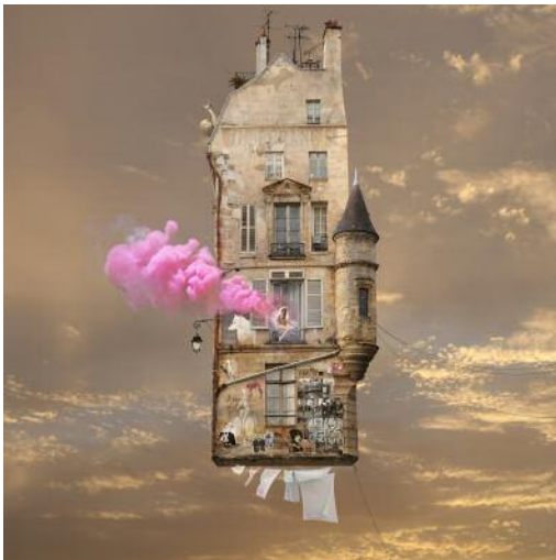
9 PINK / Rose © Laurent Chéhère