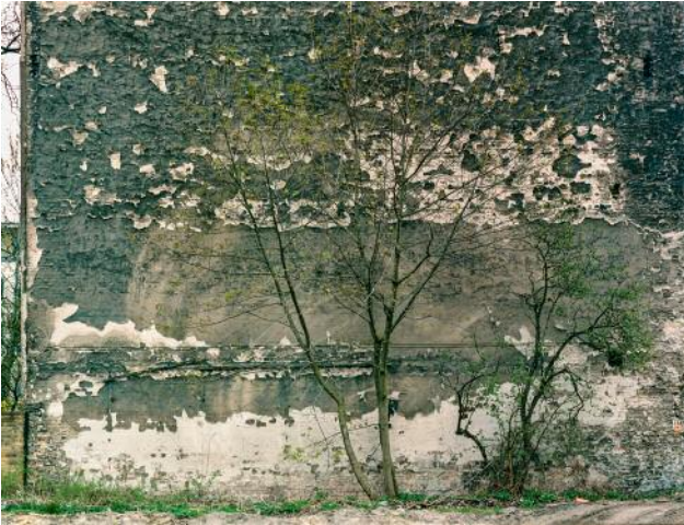
01_Stralau, 2005