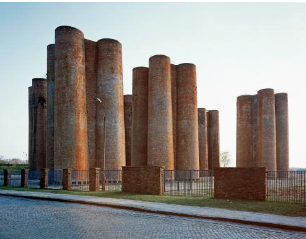
09_Biotürme (Weisse Elefanten), Lauchhammer (D), 2005