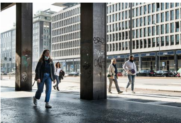
11_Stazione Centrale, Mailand (Stadtmensch), 2021