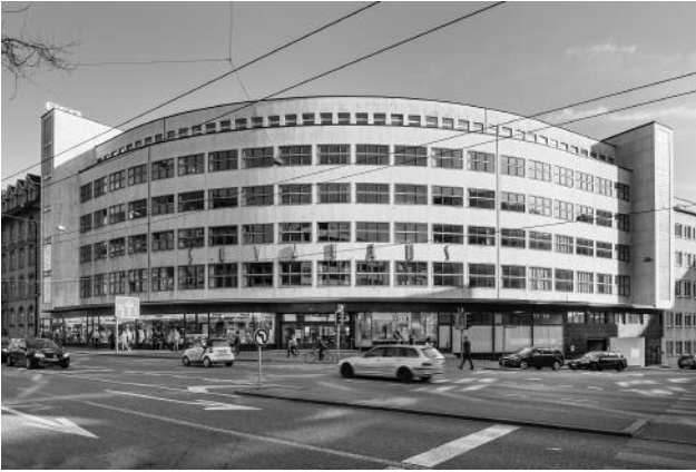
07_Suva-Haus (1931), Bern (Bauten der Moderne), 2014