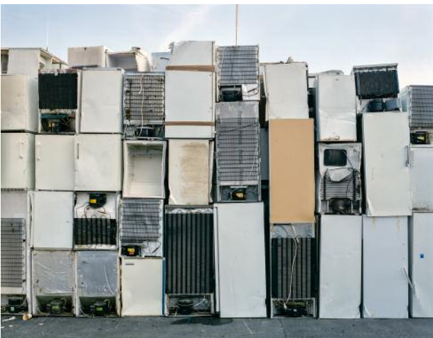
05_Kleine Allmend, 2005