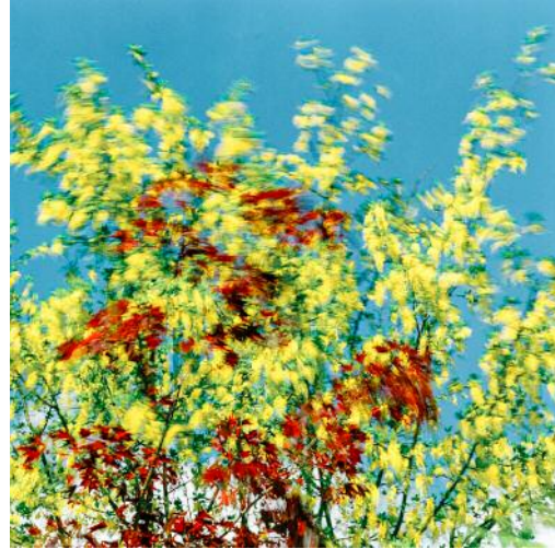
02_Leissigen (Makan), 2001