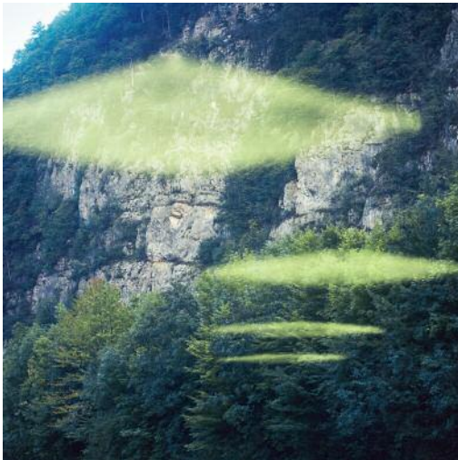
03_Heimwehfluh (Makan), 2000