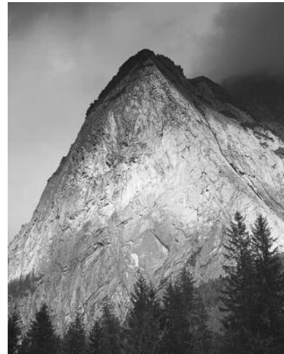
04_Mittagsfluh, 2008