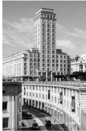
08_Tour Bel-Air (1932), Lausanne (Bauten der Moderne), 2017