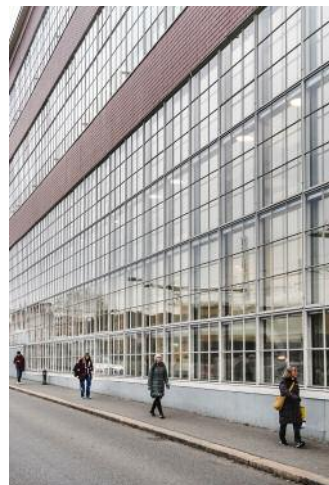
12_Sulzer-Areal, Winterthur (Stadtmensch), 2021