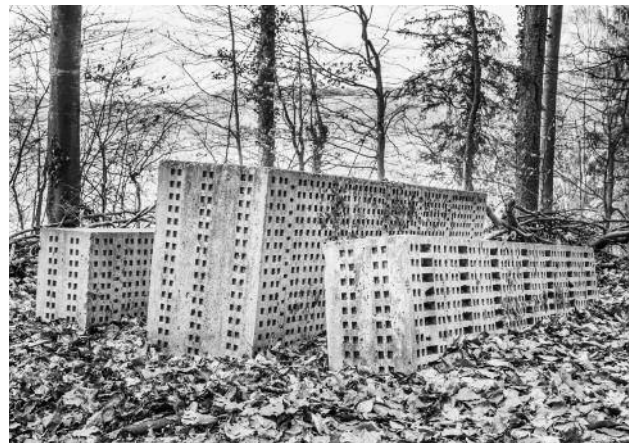
06_Belpberg, 2021