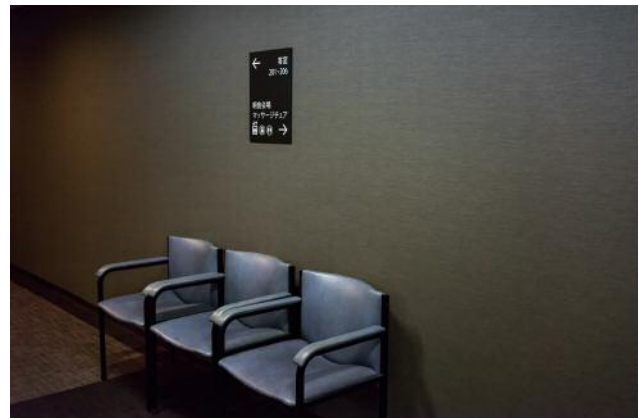
10_Happy Hotel in Seta.