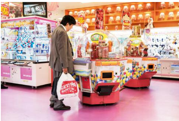
3_Spielhalle in Shibuya, Tokio: Die knallig bunt eingerichteten Spielhallen sind ein beliebter Zeitvertreib.