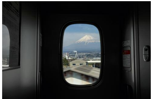
6_Zugfahrt im Shinkansen von Mishima nach Shizuoka.