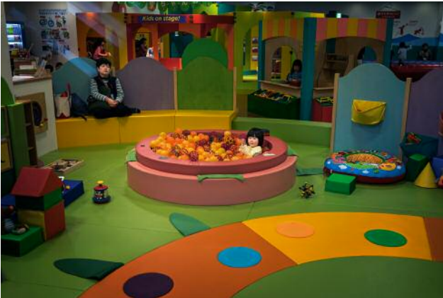
7_Kinderbetreuung in einem Einkaufszentrum in Hiroshima.