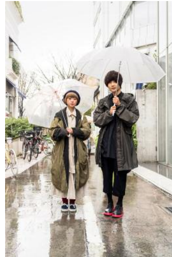
8_Auf der Omotesando-Straße in Tokio. Das Viertel im Stadtteil Shibuya ist für trendige Mode-Outlets und für anspruchsvolle Architektur bekannt.