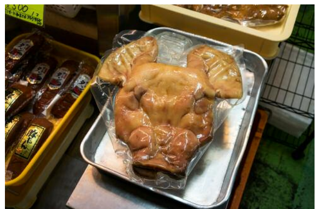
12_Ein vakuumierter Schweinekopf auf einem Markt in Naha, Okinawa.