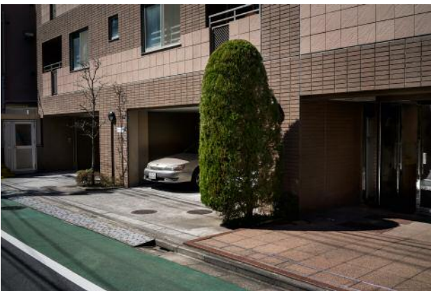
9_Luxuswohnhaus in Shirokane, Tokio.