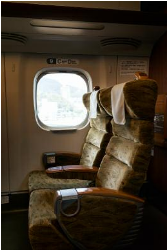
1_Sitzinterieur eines Shinkansen im Stil der 1970er-Jahre.