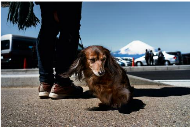
5_Eine Ausflüglerin mit Hund auf einem Parkplatz unweit des Fuji.