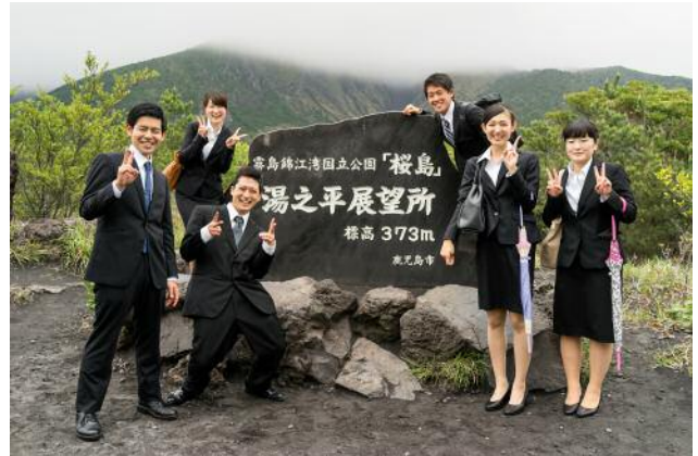
2_Aussichtspunkt auf der Vulkaninsel Sakurajima.