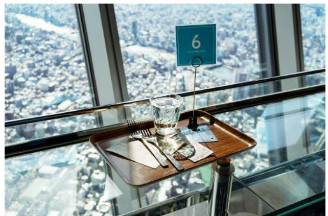
4_Blick über Tokio aus dem Restaurant des Skytree Restaurant in 350 m Höhe. Der Fernsehturm ist der höchste begehbare Ort.