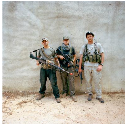
02 © Christopher Sims