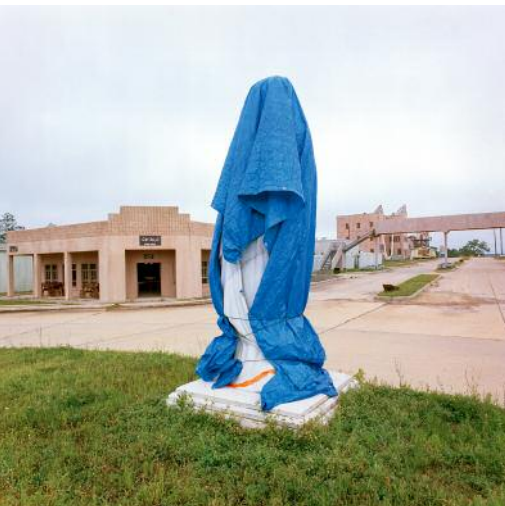
11 © Christopher Sims