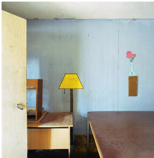
03 © Christopher Sims