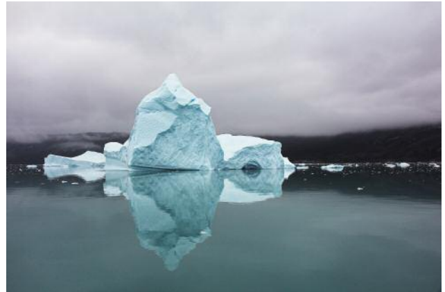
8 © Ulrike Crespo