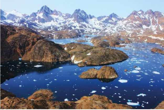
1 © Ulrike Crespo