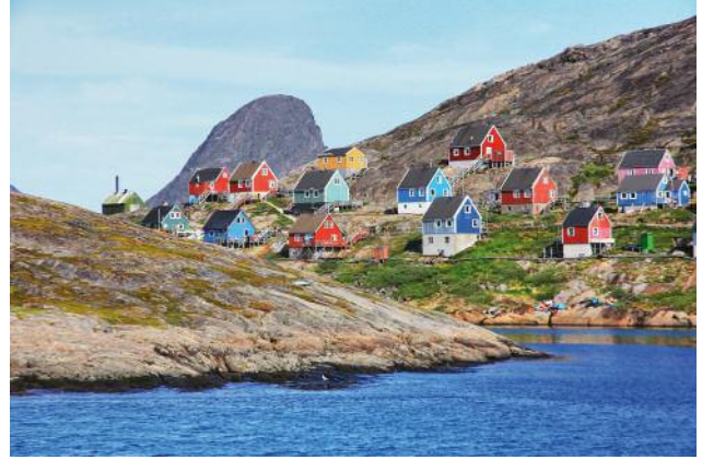
2 © Ulrike Crespo