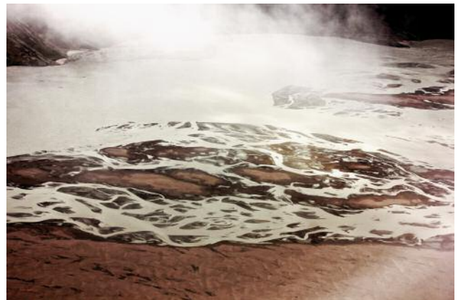
6 © Ulrike Crespo