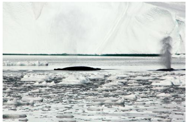
10 © Ulrike Crespo