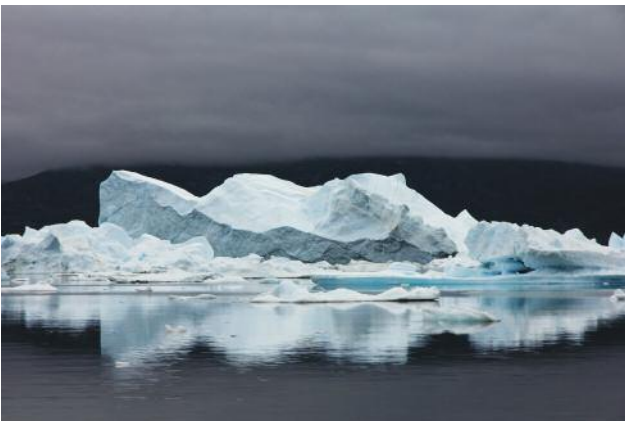
9 © Ulrike Crespo