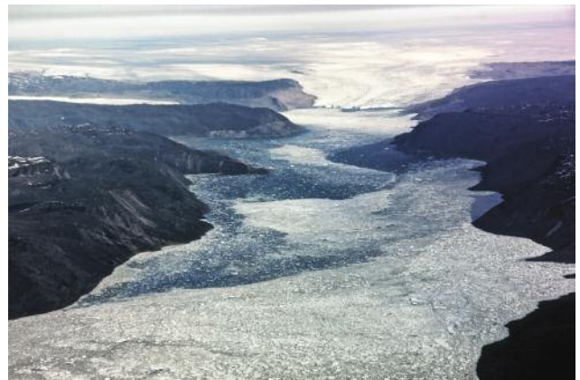
4 © Ulrike Crespo