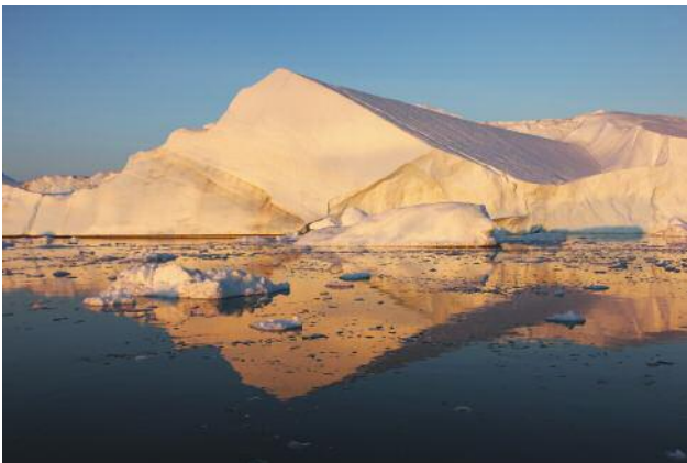
3 © Ulrike Crespo