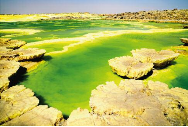
7 © Ulrike Crespo