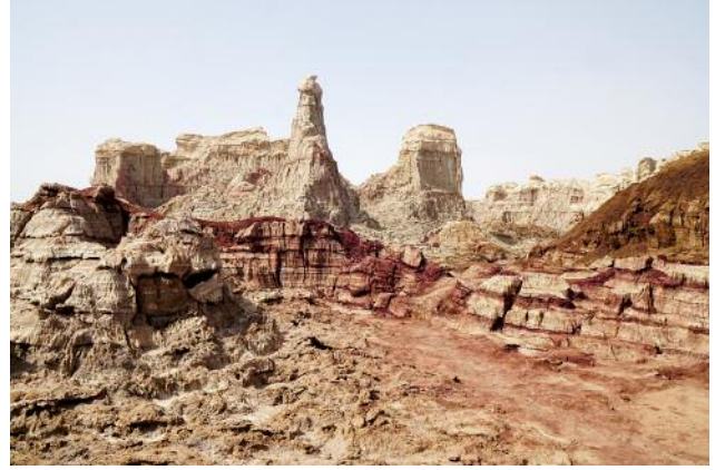
8 © Ulrike Crespo