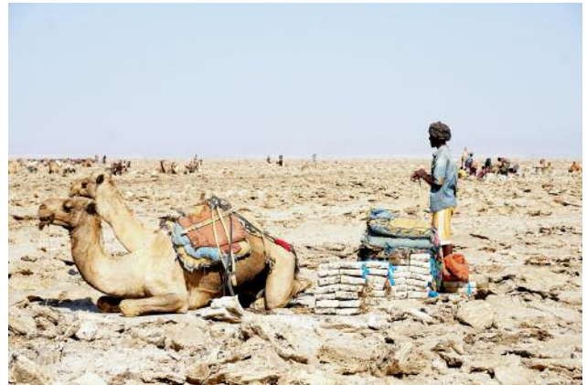
10 © Ulrike Crespo