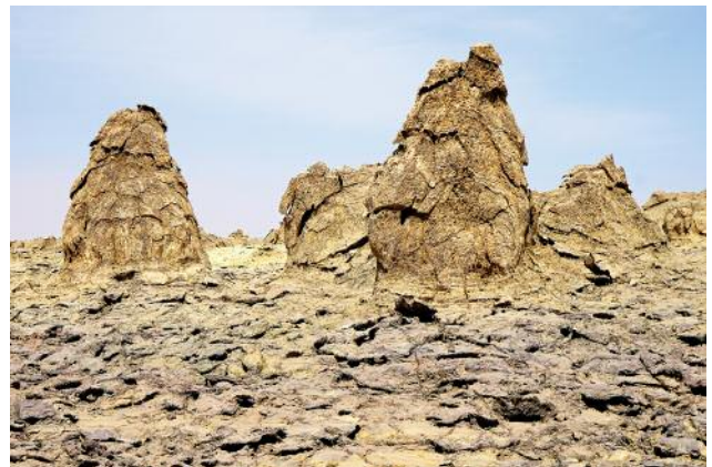
4 © Ulrike Crespo