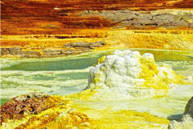
1 © Ulrike Crespo