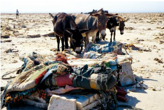
3 © Ulrike Crespo