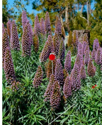
08_Pride of Madeira, Shoreline Highway, CA, 2019