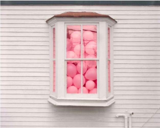
07_Pink Balloons, Doylestown, PA, 2021