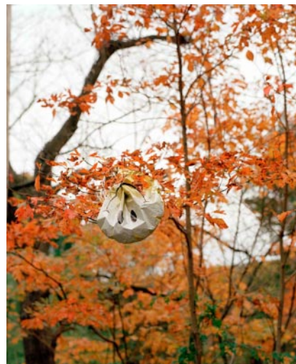
12_Upside Down Smile, Ringtown, PA, 2021