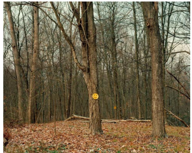
10_Graveside Smile, Manns Choice, PA, 2021