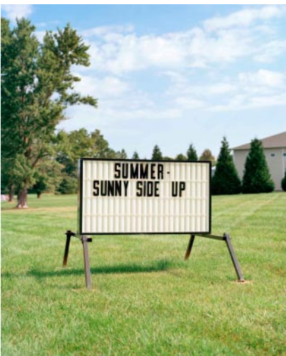
11_Sunny Side Up, Boonsboro, MD, 2022