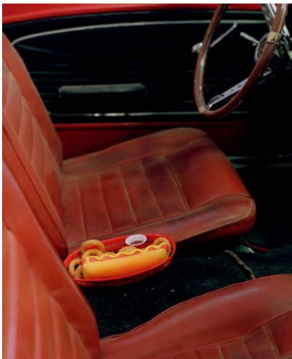
09_Dinner for One, Barstow, CA, 2022