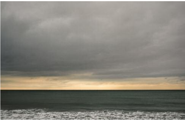
09 © Daniel Tchetchik