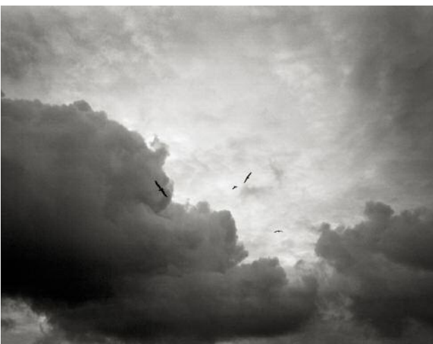
05 © Daniel Tchetchik