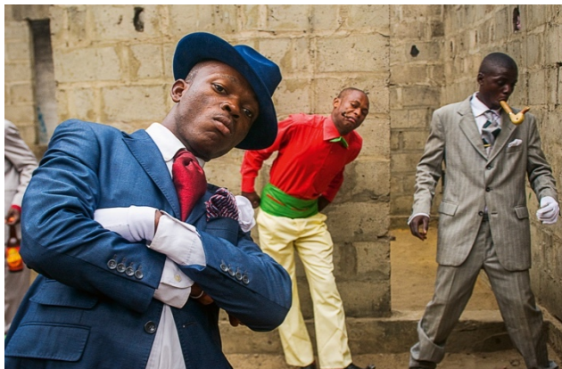
o1_Untitled, from: SAPEURS: THE GENTLEMEN OF BACONGO © Daniele Tamagni