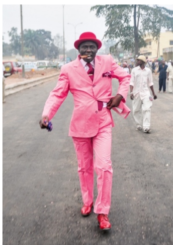
o3_Untitled, from: SAPEURS: THE GENTLEMEN OF BACONGO