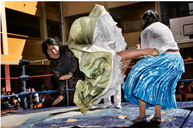
09_Untitled, from: SAPEURS: from: THE FLYING CHOLITAS