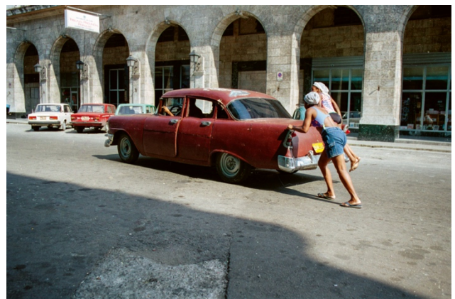
12_Untitled, from: EARLY CUBA