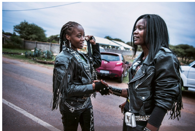
o6_Untitled, from: AFROMETAL