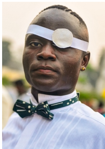
o2_Untitled, from: SAPEURS: THE GENTLEMEN OF BACONGO © Daniele Tamagni