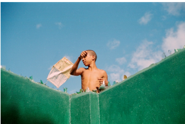
11_Untitled, from: EARLY CUBA