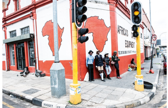
08_Untitled, from: JOBURG STYLE CREWS