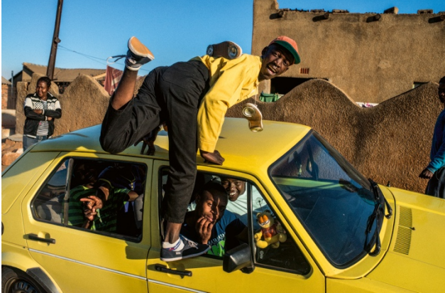
07_Untitled, from: JOBURG STYLE CREWS