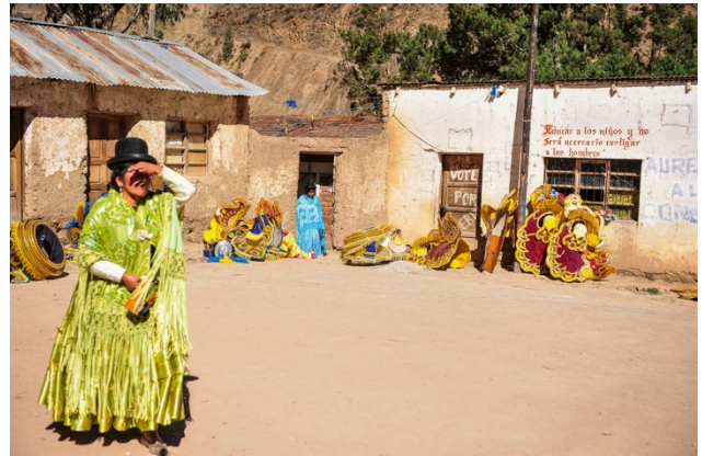
10_Untitled, from: CAMI