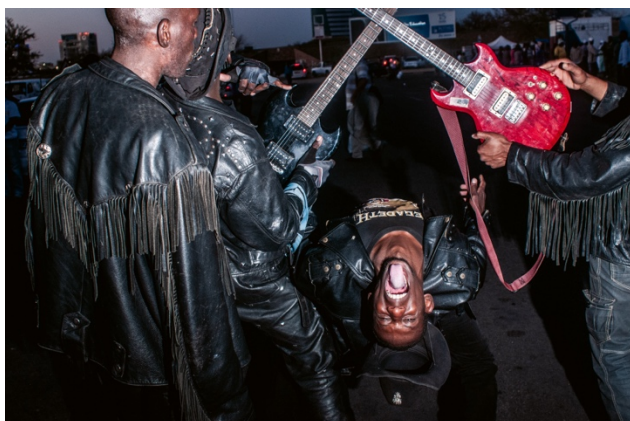
o5_Untitled, from: AFROMETAL © Daniele Tamagni