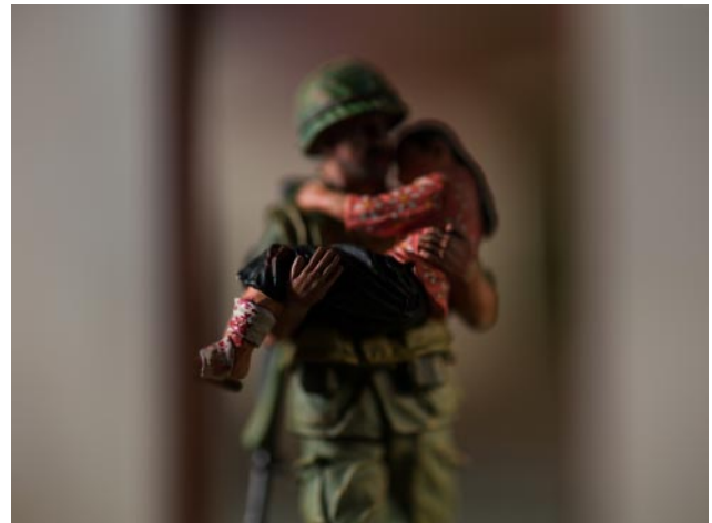
10 © David Levinthal