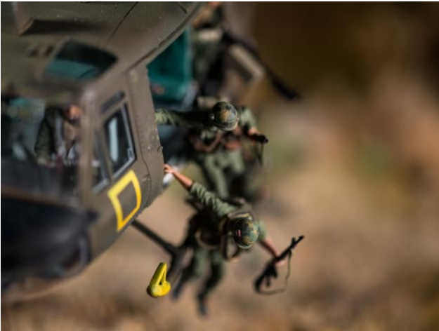
01 © David Levinthal