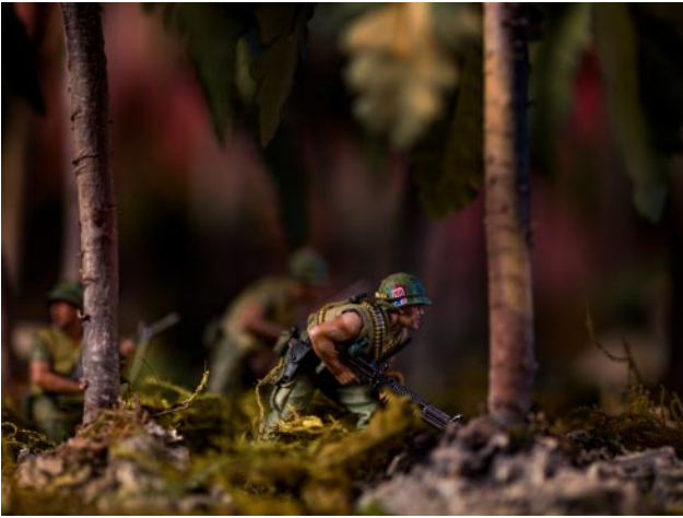
07 © David Levinthal