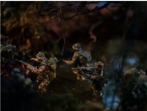
03 © David Levinthal