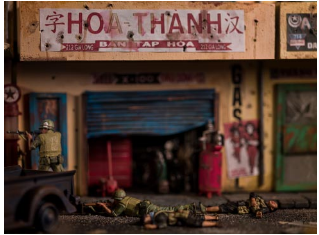
08 © David Levinthal