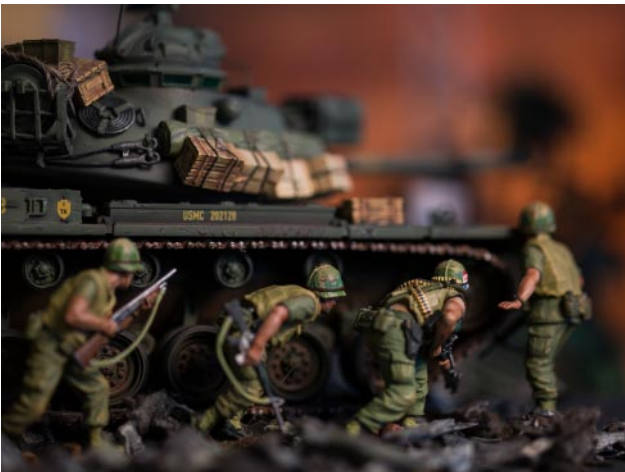
09 © David Levinthal