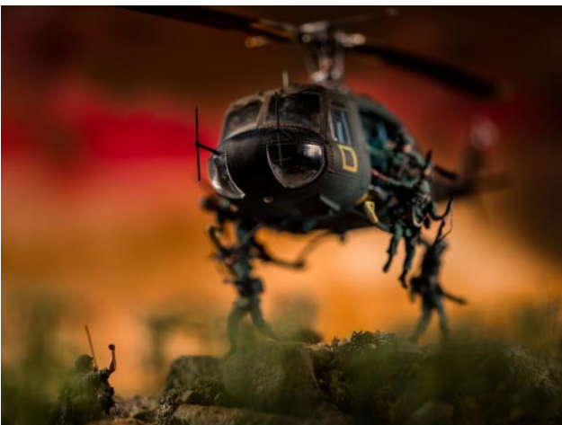
11 © David Levinthal