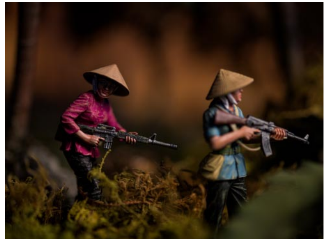
04 © David Levinthal