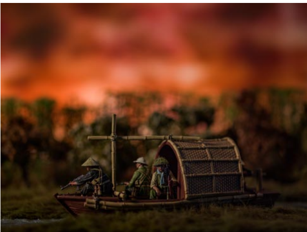
05 © David Levinthal