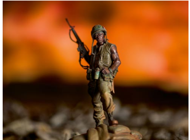
02 © David Levinthal