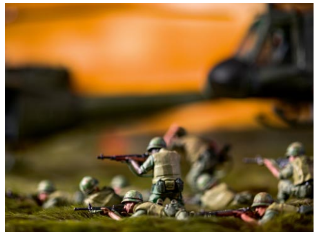
12 © David Levinthal