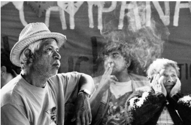
3 La Veracruz, Querétaro © Samantha Dietmar