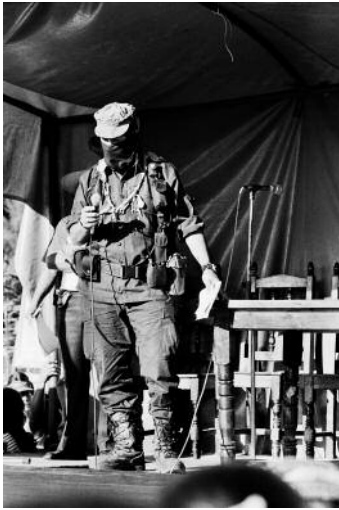
1 Nuevo Villaflores, Chiapas © Samantha Dietmar