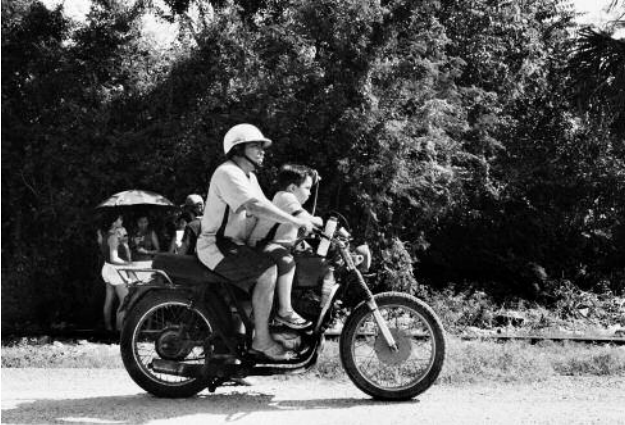
7 Along the way