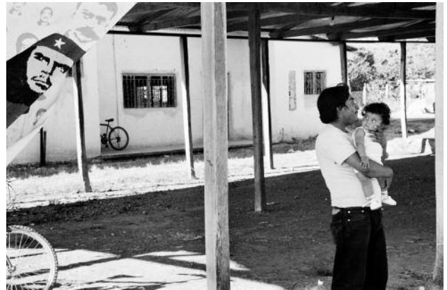
8 Nuevo Villaflores, Chiapas