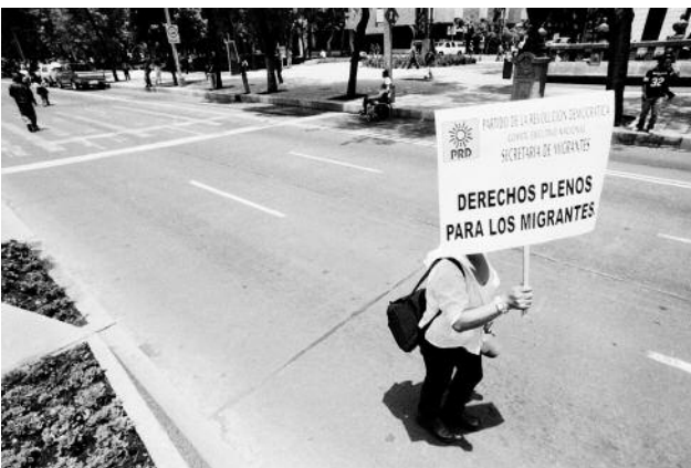
11 May 1st, Mexico City