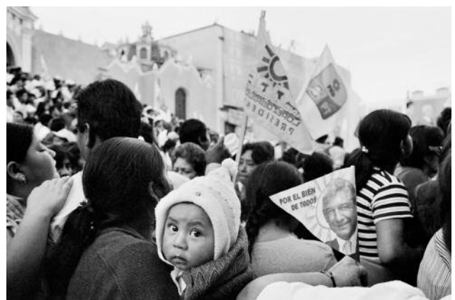
12 Xalapa, Veracruz