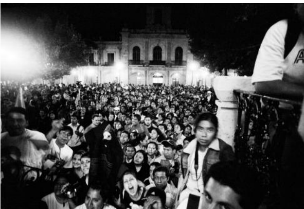
5 Oaxaca de Juárez, Oaxaca