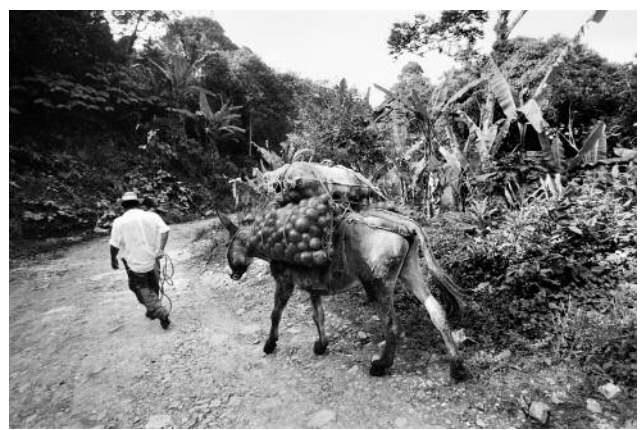
6 Near Córdoba, Veracruz