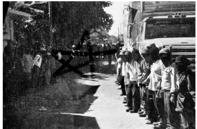
10 Huixtla, Chiapas