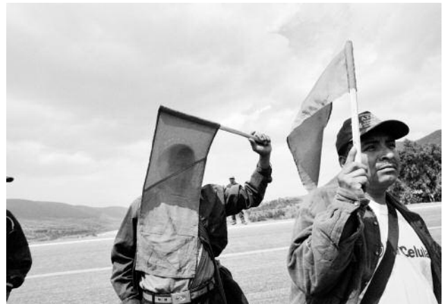
4 Tlaxiaco, Oaxaca © Samantha Dietmar