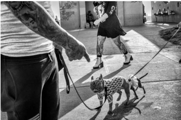
03 © Dotan Saguy