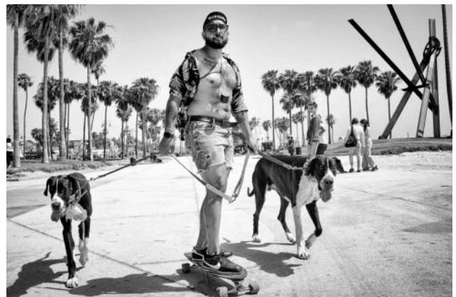
06 © Dotan Saguy