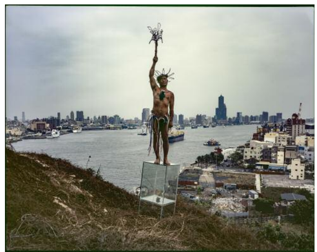
10_ The Statue of Liberty #084 , 2020 © HSU Ching-Yuan