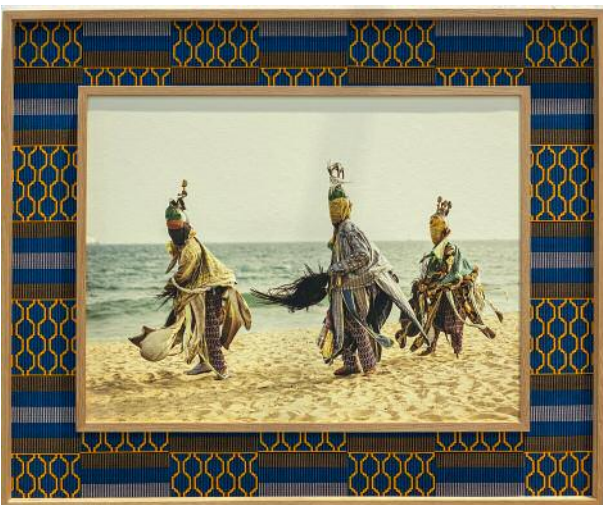
05_ aus der Serie Voodoo