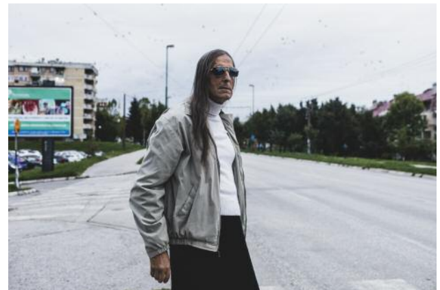
16 Sarajevo , 2019