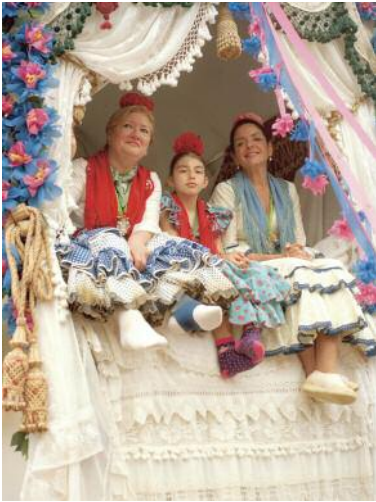
13 El rocío , 2019