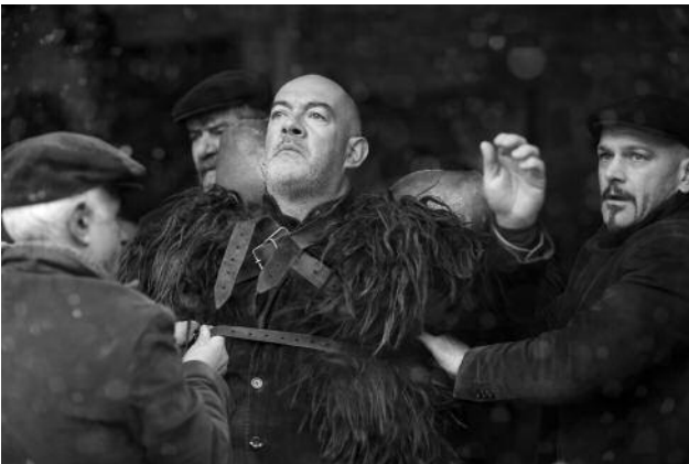
03_ aus der Serie The Mamuthones