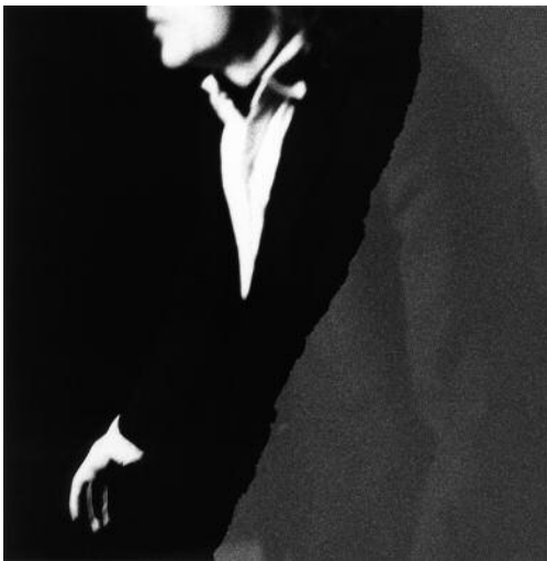
21_aus der Serie Folders, Cracks and Papers © Amin El Dib