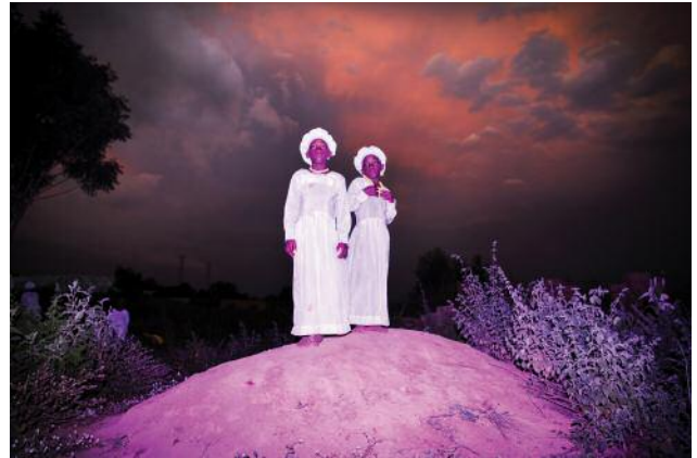
08_ aus der Serie Land of Ibeji