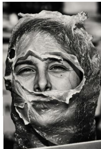
24_aus Fragiles