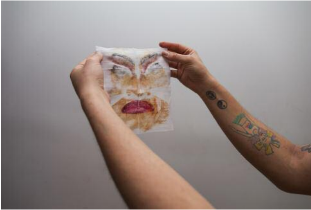
07_ aus der Serie Under Your Skin , New York, 2018–2020