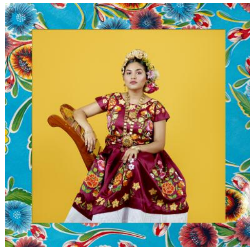
06_ aus der Serie Fleurs de l'Isthme, Mexico , 2021