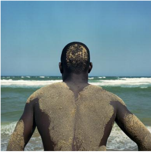
19_Catania, Sicily, Italy, August 2017