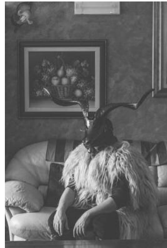
04_ Boes e Merdules Ottana, Sardinia