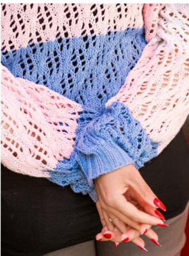
23_aus der Serie An und für sich , 2018–2022