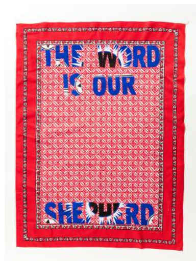
12_ The Word is our Shepherd © Lawrence Lemaona