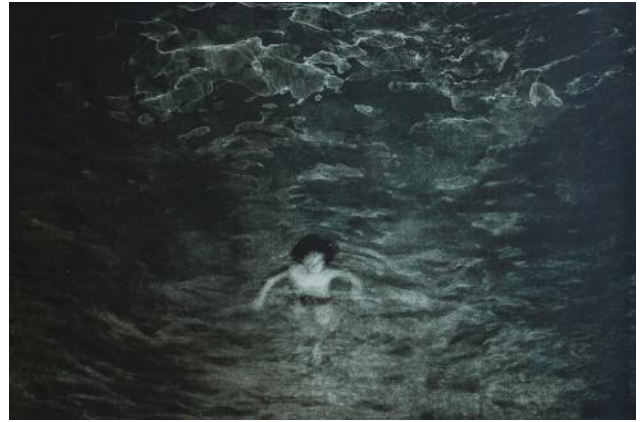
20_Passage #32, 2022