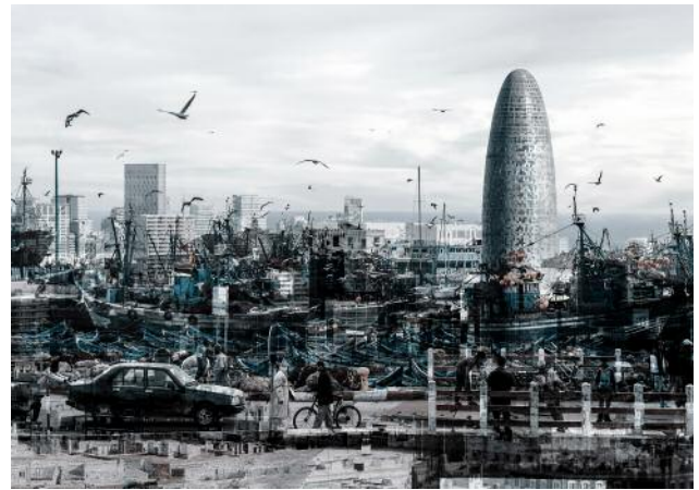
22_concrete paradise © Barbara Filips