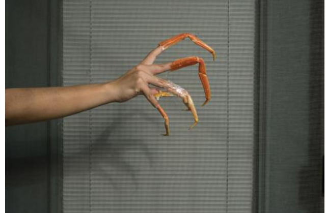
02_ aus der Serie Blood Orange / Naranja de sangre